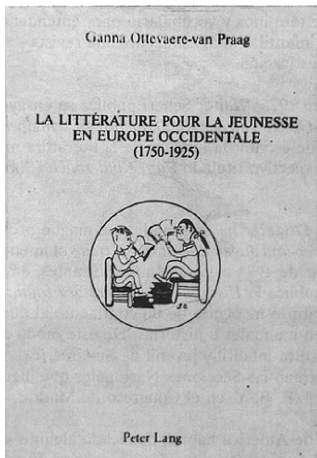
Reproducción de la cubierta de la obra de Ganna Ottevaere - Van Praag

expertos en literatura infantil, con lo que las relaciones internacionales se irán estrechando cada vez más.