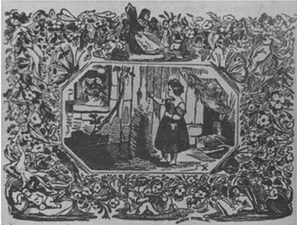
Ilustración de Albert Vogel para los Cuentos de Perrault, reproducida en Tres siglos de Literatura Infantil Europea.

Ya en 1926 Giuseppe Fanciulli publica La letteratura per l'infanzia ; en 1936 Olga Visentini publica Primo vere. Storia della letteratura giovanile y Mary Tibaldi Chiesa en 1948 Letteratura infantile , casi al tiempo que Michele Mastropalo publica su Panorama della letteratura infantile . Desde el primer momento los historiadores italianos demuestran interés por la literatura infantil europea y norteamericana, aunque se ciñan a la literatura italiana. Una mirada universal caracteriza sus obras, a pesar de la escasa documentación que poseen.