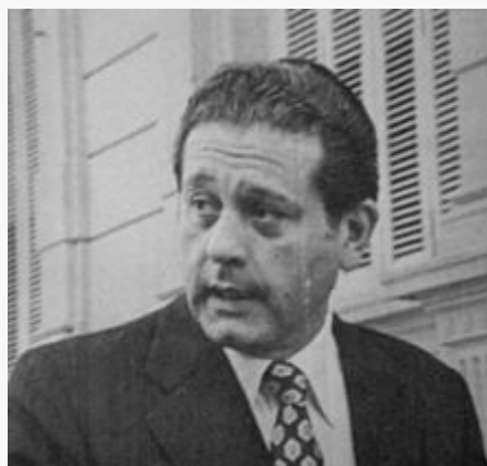
René Favalaro en 1976