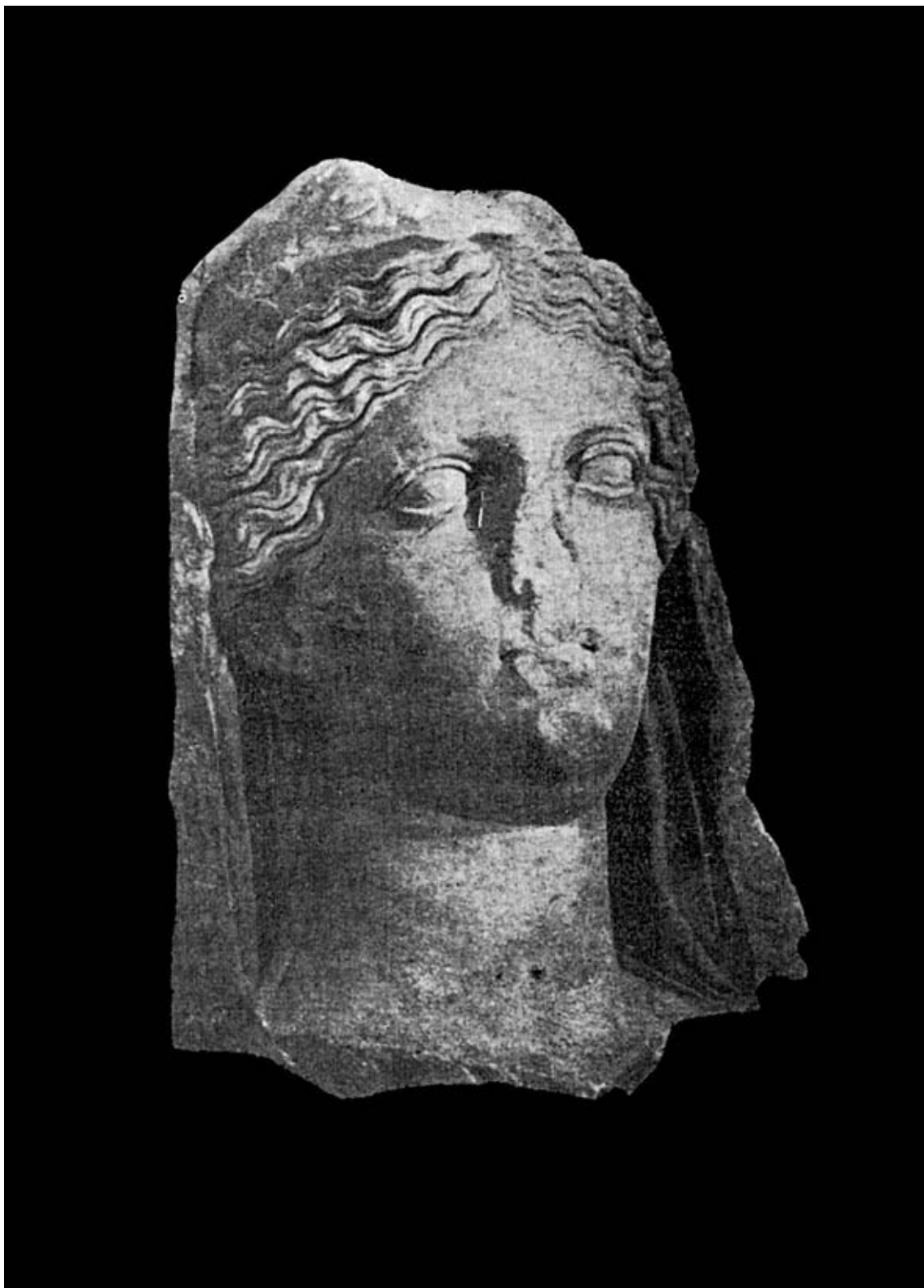
Lado derecho de la figura anterior.