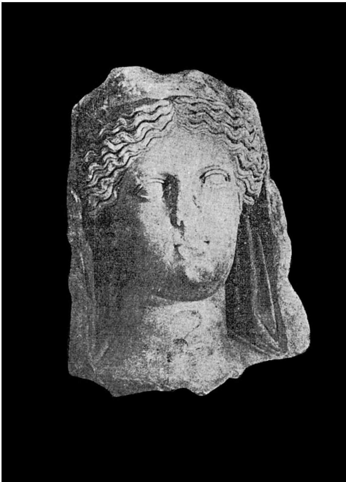
Cabeza romana de la colección Arrese.