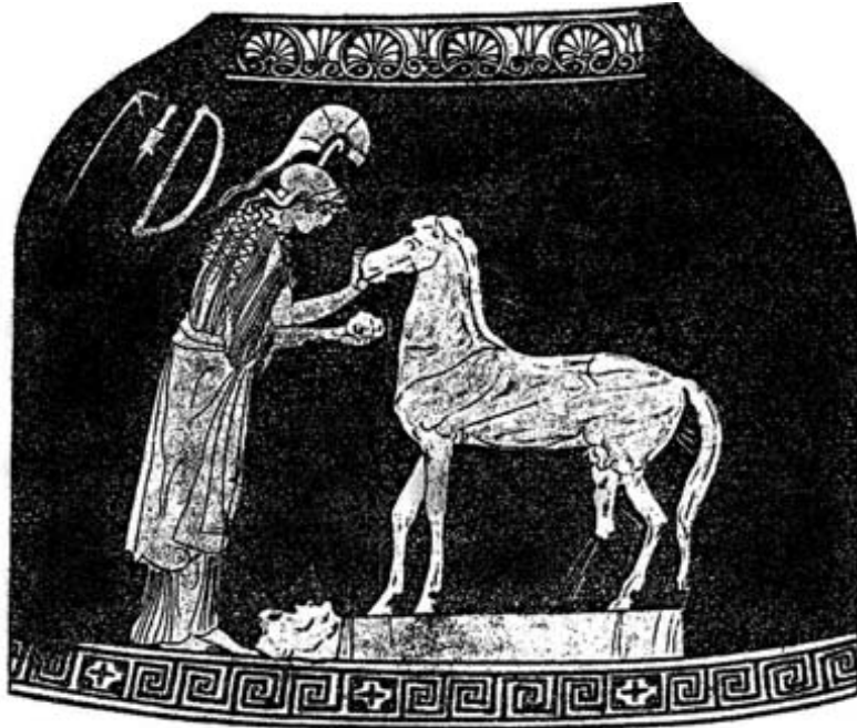
Atenea modelando un caballo. (Según Furwängler-Reichhold).

José María Blázquez: Las diosas sagradas de Elche