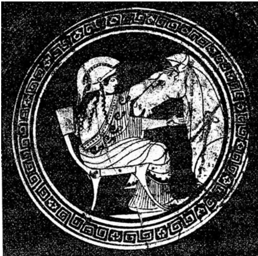
Atenea, señora de los caballos (Museo de Florencia).