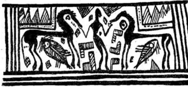
Potnias hippon (Museo de Atenas)