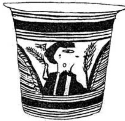
Fig. 3. Diosa andrófora. Colección particular (Según Ramos Folqués)