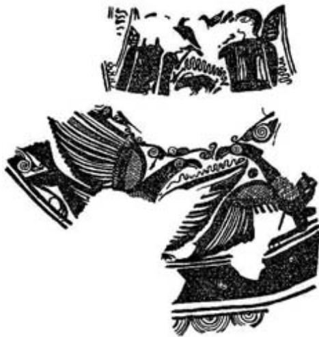
Fig. 2. Diosas aladas. Elche. Colección particular (Según Ramos Folqués)