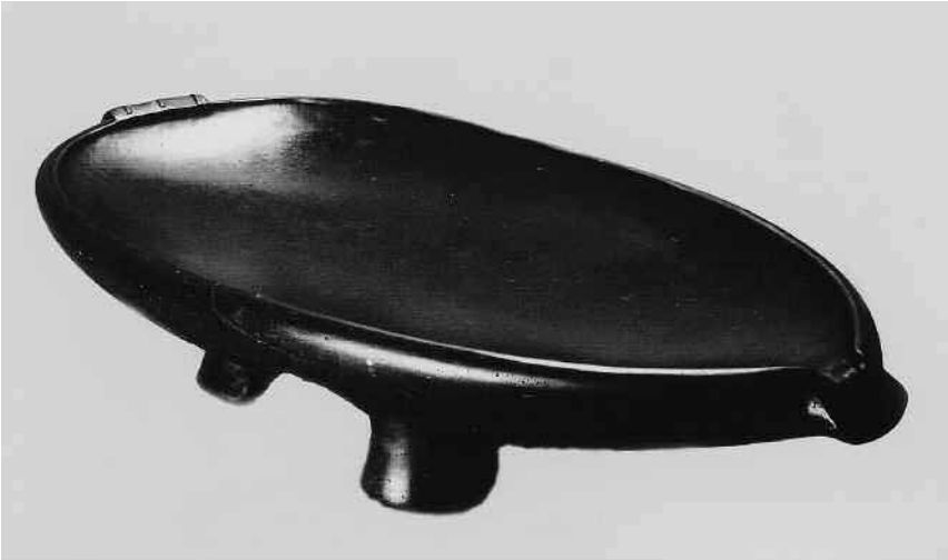
Figura 2: Batea o umete de piedra negra regalado por el jefe Tu de Tahití a Máximo Rodríguez (Expedición de Bonaechea (1774-75) como regalo para el rey de España. Museo Nacional de Antropología (Madrid). N° Inv. 1260.