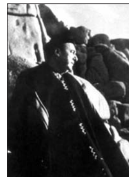
Neruda en Machu Picchu.

La imagen de la exactitud de Machu Picchu nos plantea otra posibilidad de juego intertextual, dado que ya Neruda la había utili-