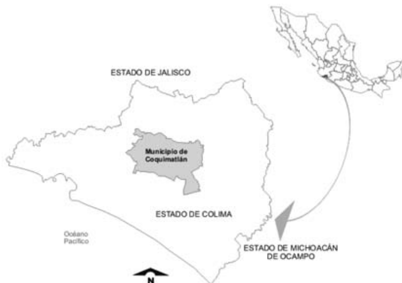
Mapa n.º 1: El municipio de Coquimatlán, Colima.

Coquimatlán es uno de los 10 municipios que componen el pequeño estado de Colima (Mapa n.º 1); su cabecera se llama también Coquimatlán y sus principales actividades económicas son la agricultura 3 y la ganadería 4 ; se trata de un municipio eminentemente católico en el que, según el censo de población del año 2000, el 96,64% de las personas declararon pertenecer a esta religión, superando el 93% a nivel estatal y el 88% a nivel nacional 5 .