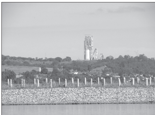
FIGURA 12. Paisaje con menor puntuación para el parámetro « aspecto general » en el entorno del embalse de la UHE Funil en el municipio de Ijaci, MG.