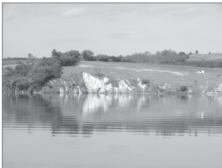
FIGURA 5. Paisaje con menor puntuación para el parámetro «efecto del relieve», en el entorno del embalse de la UHE Funil, en la municipio de Ijaci, Lavras.