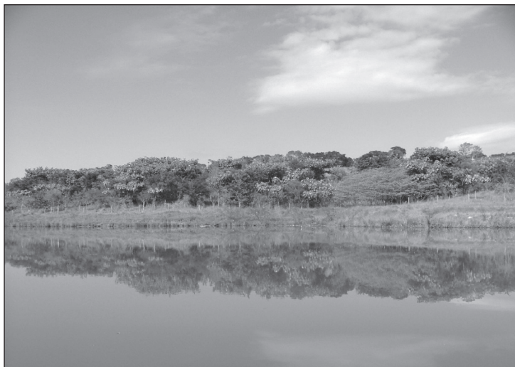
FIGURA 6. Paisaje con la puntuación mayor para el parámetro «efecto de la cubierta», en el entorno del embalse de la UHE Funil, en el municipio de Ijaci, Lavras.

Teniendo en cuenta, esas precisiones, el paisaje con mayor puntuación (28/30) corresponde al proyecto para la recuperación del bosque de ribera desarrollado por la Ufla (figura 6) (UTM coordenada: X = 509223.297 m. y 7660122.550 Y = m. N.). Los factores determinantes en esa valoración altamente positiva son: la relación aspecto salvaje/fragmento del bosque, la variedad significativa de masas (biodiversidad), el ajuste normal, en términos de naturalidad, de las estructuras y la presencia de un elemento particular o de un detalle positivo como es el proceso de la recuperación del bosque de ribera.