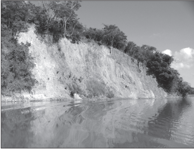
FIGURA 7. Paisaje con menor puntuación para el parámetro «efecto de la cubierta», en el entorno del embalse de la UHE Funil, en el municipio de Ijaci, Lavras, MG.

Dado el interés y el atractivo que revisten las masas de agua, pero a la vez, el valor homogéneo que en el ámbito de estudio tiene, dada su calidad (turbidez) y su carácter predominante, ya que se han evaluado los paisajes ribereños del embalse, se incluye el paisaje con «efecto espejo perfecto» puntuado con el máximo valor (5) para la calidad del agua (NTU = 9.06). Se localiza (figura 8) en la propiedad rural de Don Tónico Leôncio (coordenadas geográficas UTM: X = 509033.788 m E; Y = 7660969.018 m N). Es la luminosidad, la calidad y el efecto lumínico del agua dada su gran transparencia la que determina la atracción ejercida por esta unidad paisajística.