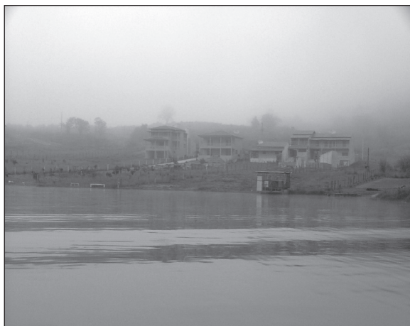
FIGURA 10. Paisaje con menor puntuación en el parámetro «efecto de la ocupación humana» en el entorno del embalse de la UHE Funil, en el municipio de Ijaci, MG.

La integración de los usos antropogénicos en el paisaje fue el factor fundamental a la hora de puntuar el efecto de la ocupación humana en el entorno del embalse do Funil. Las actividades que prestaron escasa atención a su inserción en el entorno, especialmente las aparecidas tras la creación del reservorio de agua, fueron altamente penalizadas, además de generar un cierto rechazo por parte de la población.