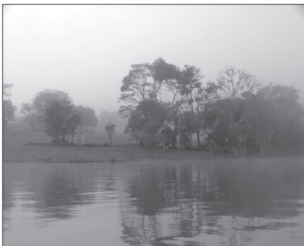
FIGURA 9. Paisaje con mayor puntuación en el parámetro « efecto de la ocupación humana » en el entorno del embalse de la UHE Funil, en el municipio de Ijaci, MG.

Los paisajes con las puntuaciones más elevadas (8/10 y 7/10) aparecen representados en la figura número 9, que se localizan en la comunidad del Barreiro (coordenadas geográficas UTM: X = 501246.260 m. E.; Y los = 7662536,801m. N.). El factor determinante de tal puntuación fue que los elementos antrópicos se encontraban en armonía con el paisaje, es decir, que los usos humanos no generaban fuertes impactos en el entorno. En la comunidad del Barreiro, la formación del embalse afectó una propiedad rural cuya ocupación se realizó de forma discreta.