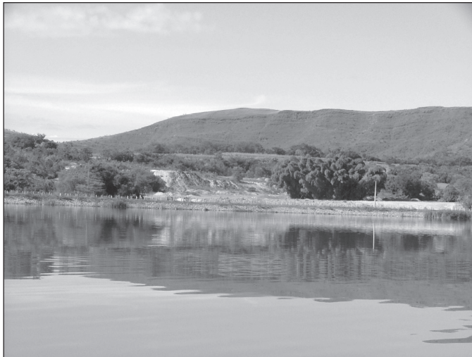
FIGURA 2. Paisaje con la puntuación mayor del parámetro «amplitud de visión» en el entorno del embalse de la UHE Funil, en la municipio de Ijaci, Lavras, MG.

El paisaje con la mayor puntuación (22/25) aparece reproducido en la figura número dos. Corresponde a la Comunidad de la Serra, con la Serra do Jaci al fondo (Coordenadas UTM: X = 509579,181 m. E.; Y = 7657860,771 m. N.). Los factores que definen a este paisaje son: una cuenca visual pura o efectiva, promedio de la incidencia visual (luminosidad) elevado y unas condiciones medias la visibilidad y potencial de la visualización alta y/o media.