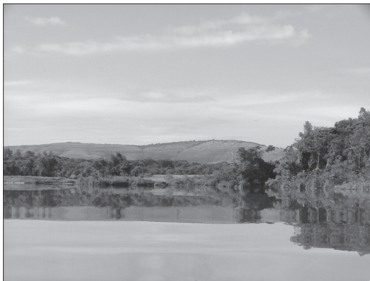
FIGURA 4. Paisaje con la puntuación mayor para el parámetro «efecto del relieve», en el entorno del embalse de la UHE Funil, en la municipio de Ijaci, Lavras.