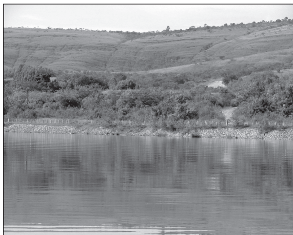
FIGURA 11. Paisaje con la puntuación más elevada para el parámetro « aspecto general » en el entorno del embalse de la UHE Funil en el municipio de Ijaci, MG.