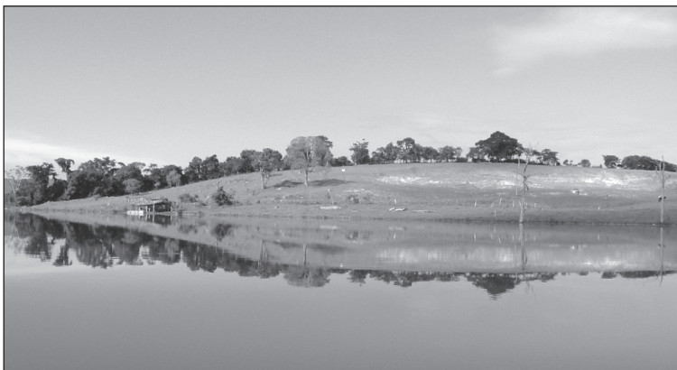
FIGURA 8. Paisaje con el «efecto espejo perfecto», puntuada en el entorno del embalse de la UHE Funil, en el municipio de Ijaci, Lavras, MG.

Dado el interés y el atractivo que revisten las masas de agua, pero a la vez, el valor homogéneo que en el ámbito de estudio tiene, dada su calidad (turbidez) y su carácter predominante, ya que se han evaluado los paisajes ribereños del embalse, se incluye el paisaje con «efecto espejo perfecto» puntuado con el máximo valor (5) para la calidad del agua (NTU = 9.06). Se localiza (figura 8) en la propiedad rural de Don Tónico Leôncio (coordenadas geográficas UTM: X = 509033.788 m E; Y = 7660969.018 m N). Es la luminosidad, la calidad y el efecto lumínico del agua dada su gran transparencia la que determina la atracción ejercida por esta unidad paisajística.