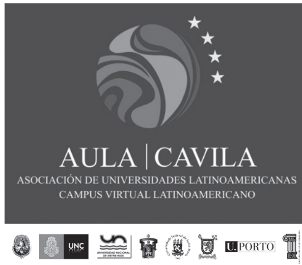
Figura 1. Marca AULA-CAVILA

Bajo este contexto y atendiendo a las reiteradas Declaraciones de las sucesivas Cumbres de Rectores Iberoamericanos, se plantea AULA (Asociación de Universidades Latino-americanas) para la integración de la enseñanza superior entre distintos países Iberoamericanos mediante el uso de las Nuevas Tecnologías y como una respuesta a la globalización y a los nuevos retos contemporáneos, que requieren nuevos cambios en las capacidades en procura de disminuir la brecha y los desequilibrios socioeconómicos.