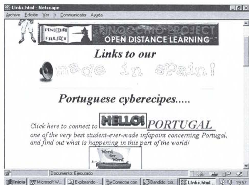
Ilustración 2: Guía informativa sobre Portugal elaborada por alumnos de los IES Ibáñez Martín y Ramón Arcas de Lorca.