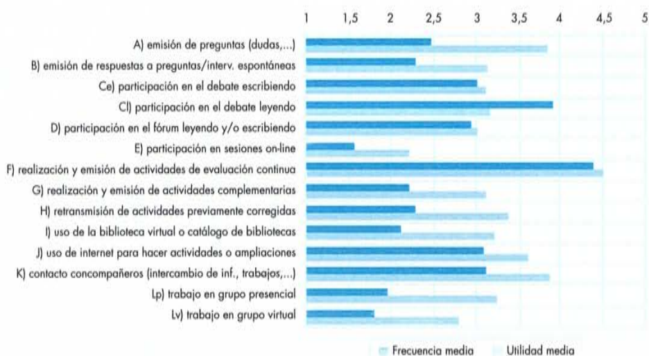
Gráfica 1. Actuaciones de estudio dentro del campus virtual

Del conjunto de las 23 actuaciones de estudio antes enunciadas, se ha hecho un análisis de la frecuencia con la que los estudiantes las utilizan y de la utilidad que tienen para ellos en el momento de desarrollar las distintas asignaturas atendiendo a la clasificación presentada con anterioridad referida a la diferenciación de actuaciones que requieren el campus virtual y actuaciones que no lo requieren.