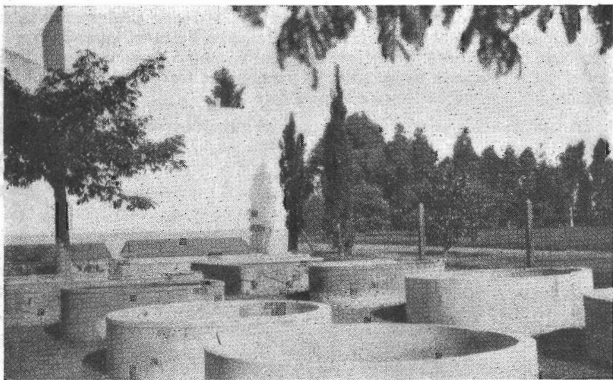
Instalaciones de la Estación Hidrobiológica de Rosario para el cultivo de "pulgas de agua".