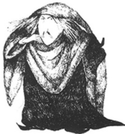
Il. de Viví Escrivá para El bosque encantado , de Joles Sennell (Madrid: Espasa Calpe, 1985).

Citemos, por ejemplo, un cuento que a los adultos suele horrorizar y que muchas veces es eliminado del repertorio de las historias aptas para los pequeños. Estoy hablando, nada menos, que de Hansel y Gretel . La trama es espeluznante. Una noche, mientras los niños duermen, la malvada madrastra y su marido se quejan de lo pobres que están. Como no tienen con qué alimentar a los niños, ella sugiere que los abandonen en el bosque. La idea no es del todo descabellada ni perversa: quizá alguien se compadezca de ellos y encuentren un destino mejor. Lo que sigue, ya lo sabemos. Los niños escuchan y hacen planes, pero al fin tienen que pasar por todo el lío de la falsa casa de chocolates y de la bruja y del horno, etcétera, etcétera.