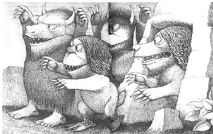
Il. de Maurice Sendak (detalle), para Donde viven los monstruos , (Madrid: Alfaguara, 1977).