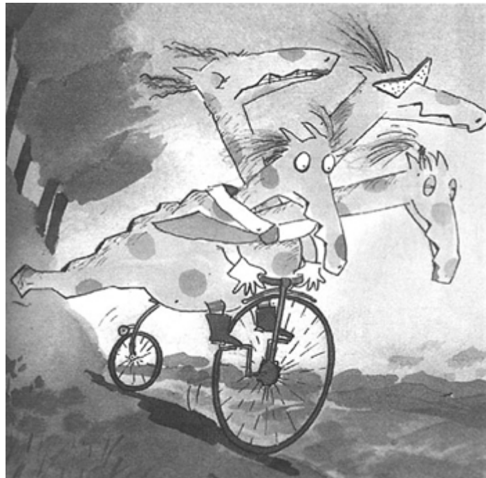
Il. de Montserrat Ginesta para El último dragón y la sombrerería , de Antoniorrobes (Barcelona: La Galera, 1985).

angustia. Esa angustia, que tantas veces es una sensación confusa e incierta, logra elaborarse en imágenes concretas y, de esa forma, encuentra salidas. A los personajes que la representan, el niño puede odiarlos