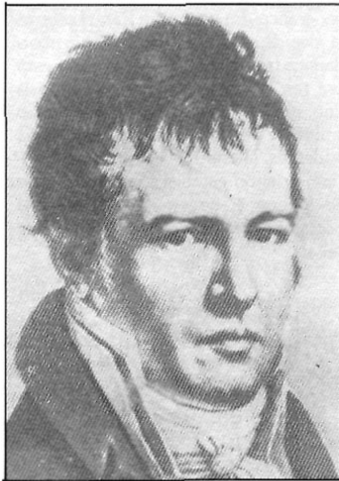
Alejandro Von Humboldt

En estas obras Humboldt presenta una serie de descubrimiento particulares en los campos de la biología, botánica, la zoología, la geografía, el magnetismo terrestre, la climatología, utilizando nuevas estructuras en los métodos científicos existentes.