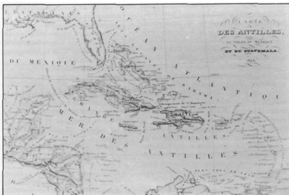
Mapa de Las Antillas

La enseñanza de la Geografía, como la de cualquier otra disciplina, es presentada en una forma evolutiva o concéntrica, como corresponde a su método pedagógico. El estudio de la Geografía está distribuido en cuatro secciones: la Geografía Intuitiva, la Geografía Inductiva, Geografía Deductiva y la Geografía Sistemática o Científica.