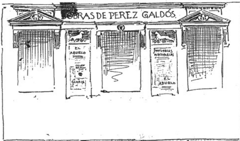
Figura n.º 6