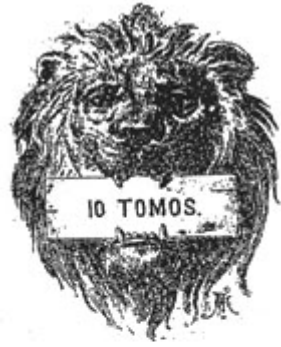
Figura n.º 2