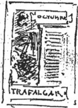
Figura n.º 5

He pensado hacer unas cabece- ras de hecho memo- rables en cada mes. MAYO - 2 de 1808 JULIO - BALEN OCTUBRE TRAFALGAR X - X - Vesicito y y el me de ese dis- tribucion histórica de los 12 meses.