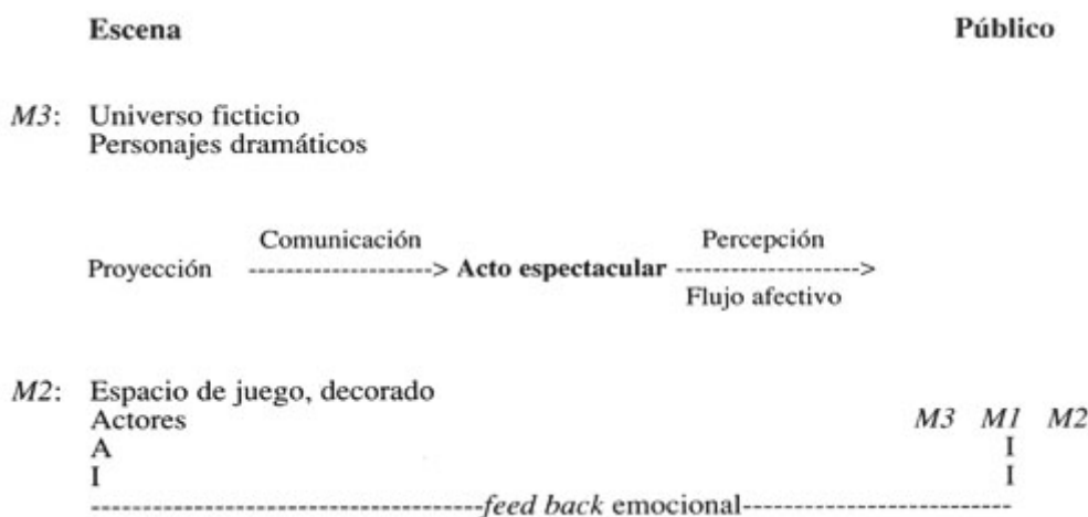
Figura 4: Proyecciones semánticas en el «circuito teatral»

El mundo M3 interviene tanto en el espacio escénico, poblado por personajes dramáticos, como en el proceso de «lectura» del espectador. La representación escénica recibe a su dramatis personae por medio de una proyección de unos acontecimientos de tipo M2 , dentro del cuadro escénico creado. La enunciación tiene lugar por medio de actos verbales o gestos corporales, efectuados por cuerpos imaginarios -apariciones mentales fantásticas de M3 , los personajes dramáticos-, interpretados por los actores que existen, actúan y sienten en un universo comunicacional real de tipo M2 -el mundo compartido-: