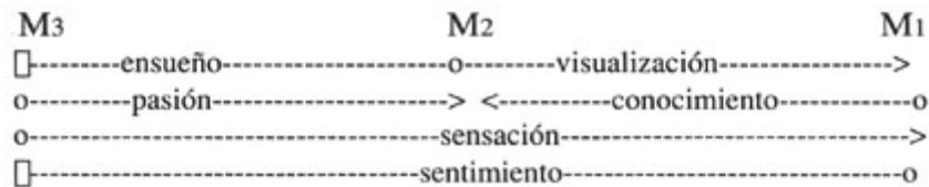
Figura 2: Las proyecciones aferentes a los mundos semánticos

Aunque la percepción, la comunicación y lo imaginario funcionan independientemente, el elemento cultural deja su huella en ellos, generando conexiones específicas, que se manifiestan por medio de proyecciones semánticas de un elemento x de M_j (donde j, k \in \{1,2,3\} , j \neq k ) y por proyecciones de las estructuras conceptuales en estos tres campos de experiencia. En el momento en el que estamos ante proyecciones fundamentales de las estructuras conceptuales, reforzadas por la existencia social, éstas van a ser confirmadas por la presencia de unas representaciones icónicas cristalizadas en expresiones lingüísticas.