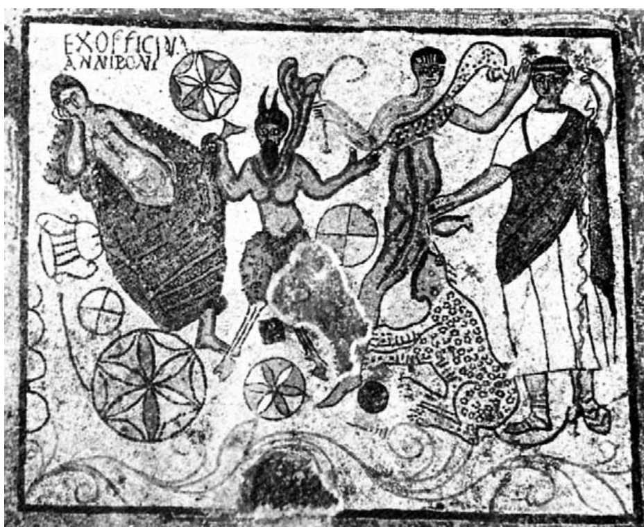
Dionisos y Ariadna. Mérida. Museo Arqueológico.

menor tamaño y rectángulos. Los paralelos para los rostros de los varones se encuentran en algunas caras de los mosaicos de Tabarka (África), fechados hacia el año 400. En estos mosaicos africanos hay también un horror vacui , la misma forma de representar la figura humana, los motivos vegetales y animales. El motivo decorativo de círculos con cuadrantes de diferentes colores se repite igualmente en mosaicos de Tabarka, en el citado de Annius Ponius , y en uno con la imagen de Ceres, procedente de Santervás del Burgos (Soria). En Tabarka también se representan granadas como simple motivo decorativo, al igual que el tema del ajedrezado con rombos blancos y negros y los frontones triangulares. La cruz gamada decoraba las dalmáticas de varios personajes de Piazza Armerina (Sicilia). Pavimentos con filas de círculos con rombos con espigas en el interior han aparecido en Hispania en Santervás del Burgos, en las villas de Liédena y de Tossa del Mar (Tarragona). La palma es un motivo indígena en estelas hispanas.