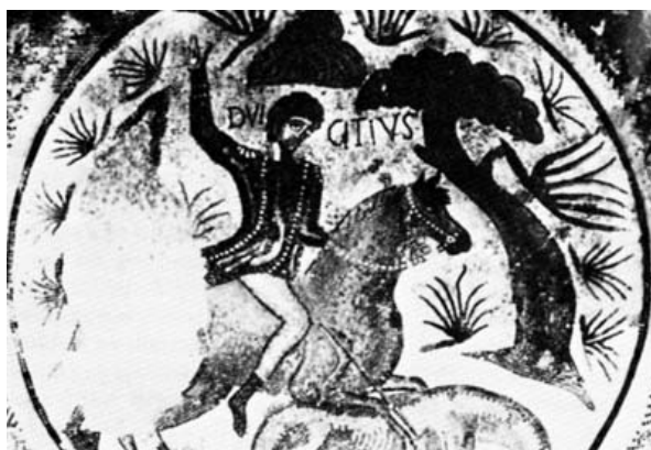
Mosaico de Dulcitus. Tudela. Museo de Navarra.

Sus cabellos están flotando al viento a la manera de los dioses celtas y todo el cuerpo está ejecutado de una manera infantil y primitiva, con algunas partes del cuerpo, como las caderas y los brazos desproporcionados. La diosa, que como afirma la mencionada autora inglesa, más parece una diosa de la fertilidad celta que una diosa romana, lleva un espejo. A su lado se encuentra de pie un tritón con la cabeza colocada de perfil, ejecutada de una manera ruda, que indica una gran torpeza en la realización. En las esquinas hay colocados, dentro de lunetas, pájaros, y en las centrales, un león, un leopardo, un toro y un ciervo, con dos inscripciones, como leo flamafer , taurus omicida . Todos los animales están ejecutados de un modo infantil y primitivo. En las concavidades rectangulares van cazadores, que siguen el mismo estilo que el del cuerpo de Venus. Todos están dibujados en negro sin ningún estudio anatómico. Uno lleva una lanza y un segundo una red. En un lado lateral está representado el busto de Mercurio, con el caduceo, entre arbustos estilizados.