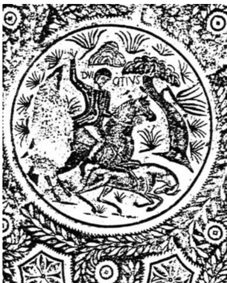
Mosaico de Dulcitius. Tudela. Museo de Navarra.

villa romana de Baños de Valdearados (Burgos), mosaico que participa de las mismas características que los anteriores, con el fondo cubierto de objetos sin ningún intento de perspectiva y con todas las personas que forman la comitiva de Baco colocadas de frente, apelotonadas y señalada su jerarquía por el tamaño de su figura, y un segundo, de época teodosiana, dado a conocer por A. Blanco, con la parte central muy dañada. En todos ellos se ha perdido totalmente la tradición de las formas antiguas, pero subsiste el recuerdo de la iconografía clásica. El estilo de la escena es totalmente diferente al de la tradición helenística de los mosaicos de este tipo. Algunas de estas características habían ya aparecido siglos antes en el arte de dos ciudades limítrofes entre el mundo romano y el parto, Dura-Europos y Palmira (ambas en Siria).