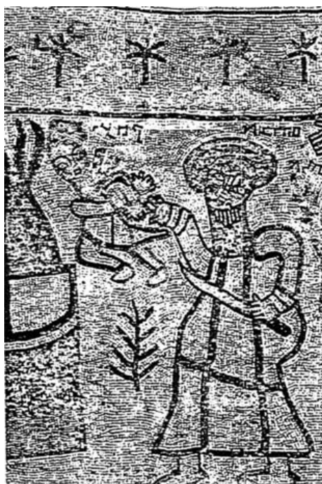
Mosaico con el sacrificio de Isaac. Sinagoga de Beth Alpha.

A final del siglo IV la zona residencial de varias villas se abandonó, lo que es indicio claro de que los dueños buscaban protección en las cercanías de la muralla, como sugiere J. Liveridge. Britania se perdió para Roma el año 407, cuando las tierras de la desembocadura del Rin y Bélgica habían caído ya en manos de los francos y de los burgundios. I. Richmond, por el contrario, es de la opinión de que el colapso del sistema de producción de las villas se debe no tanto a la inseguridad del continente, cuanto al hundimiento de los mercados, de los que la agricultura británica dependía. El hecho es que la Britania se aisló del resto del Imperio.