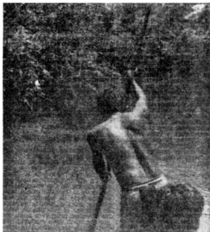
Familia india en los bancos del Amazonas.

Evidentemente, no se puede conquistar aprisa el Amazonas. Su conocimiento ha costado generaciones de investigadores, de pioneros y de aventureros, de las que pudiera decirse que se las han tragado los pantanos. Los documentos que han dejado, numerosos y diseminados, por las bibliotecas, explican tan pocas cosas, que cada viajero que se adentra por las pistas indias se siente desnudo, aislado — indefenso. Ello se debe a que este