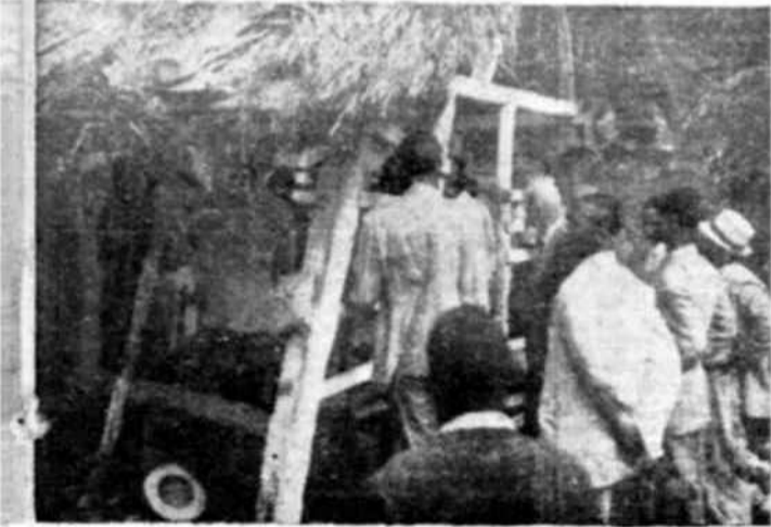
Una choza escuela en Haití.

(De la revista francesa "Presence Africaine", No 1, noviembre-diciembre 1947.)