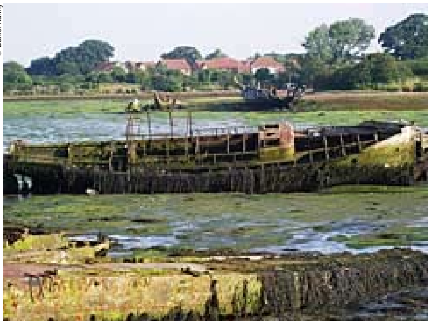
Un par de botas de pesca es todo el pertrecho que se necesita para explorar los pecios de Forton Lake.

El Mary Rose , navío de guerra favorito del soberano inglés Enrique VIII, naufragó en 1545, al poco de zarpar de Portsmouth para atajar una flota francesa que pretendía invadir Inglaterra. Hoy en día, sus restos extraídos del fondo del mar figuran entre los vestigios submarinos más famosos del mundo. Enterrado en el cieno y envuelto en una oscuridad casi total, el casco del Mary Rose fue localizado cuatro siglos después, gracias a un sonar sumamente perfeccionado. Izados a la superficie en 1982, el pecio y numerosos objetos del Mary Rose son admirados hoy por los 600.000 visitantes que acuden cada año al museo especialmente dedicado a este navío, que se halla situado en Portsmouth (Reino Unido), a unas pocas millas del lugar del naufragio.