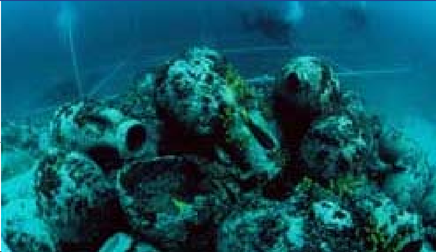
Ánforas del siglo I a.C., halladas en las aguas litorales de la isla de Pag (Croacia).