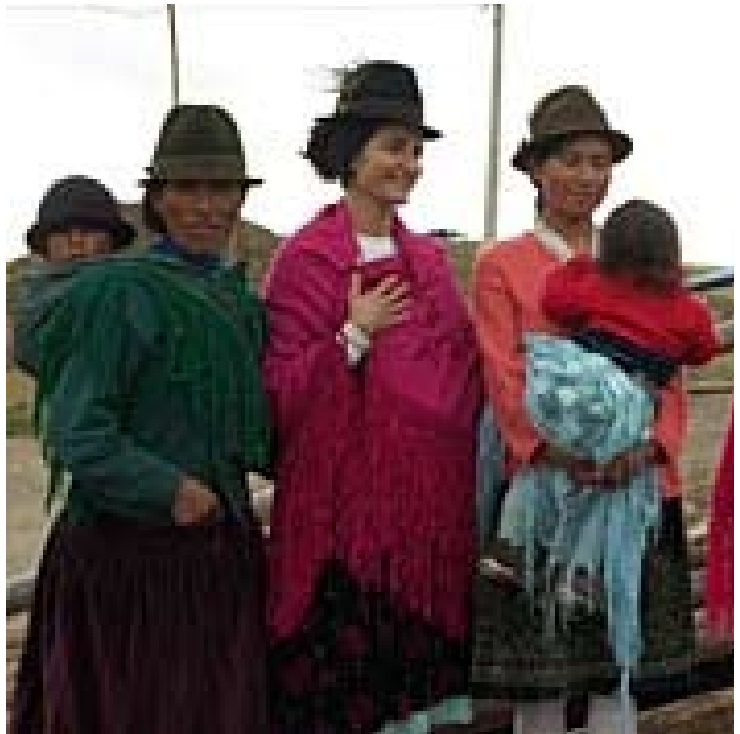
Comunidad de locutores de quichua en Cotopaxi (Ecuador).