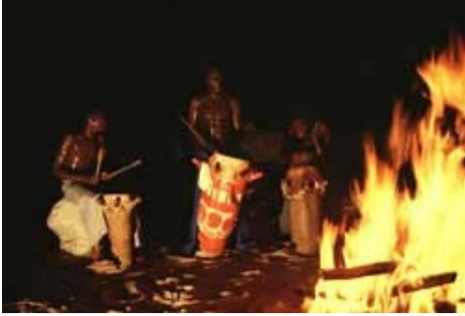
Danzas vudú alrededor de una fogata, Haití.

► cristianismo; de él tomaron lo que les convenía y conservaron una parte de sus tradiciones religiosas. Si hubiesen adoptado pura y simplemente la ideología cristiana, se habrían resignado a lo que les deparara el destino, a la espera de una vida mejor en el reino de los cielos. Ahora bien, acompañaron sus oraciones con el son de los tambores, y así aparecieron unas culturas risueñas, asociadas a la danza, a la canción, a la alegría de vivir, unas culturas que hicieron bailar a la historia.