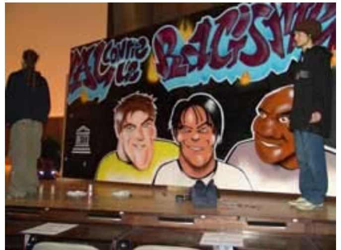
20 marzo 2004: celebración del Día Internacional de la Eliminación de la Discriminación Racial en la UNESCO.

Los que se pretendían blancos no imaginaron hasta qué punto el hecho de añadir a la dimensión esclavista esta otra dimensión psicológica tan frustrante podría llegar a crear conflictos existenciales e influir en la idea que los esclavos tenían de sí mismos y de su lugar en la especie humana. Marcar de este modo la relación entre amos y esclavos, que ya era una