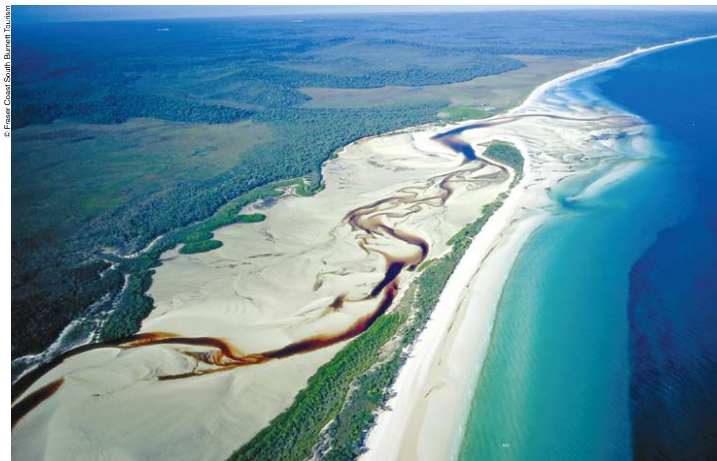
Situada frente al litoral este de Australia, Fraser es la isla arenosa más grande del mundo.

Situada frente al litoral este de Australia, Fraser es la isla arenosa más grande del mundo. Alberga un ecosistema complejo de bosques pluviales, bellísimos lagos de agua dulce en sus alturas y especímenes raros de la fauna y flora australianas.