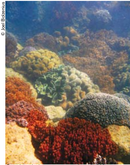
Corales de la reserva marina de Woongarra, situada en el parque marino de Great Sandy (Australia).

La noción de reserva de biosfera surgió en 1974, en el marco del Programa sobre el Hombre y la Biosfera (MAB) de la UNESCO, y la Red Mundial de Reservas de Biosfera se creó dos años más tarde. En el decenio de 1970 esa noción correspondía grosso modo a la de “zona protegida”, pero en el decenio siguiente fue englobando paulatinamente la idea de desarrollo sostenible. Hoy en día, al considerarse que las poblaciones humanas forman parte de la biosfera, el concepto de reserva de biosfera se centra más en la conservación y la educación científica con miras a promover una interacción beneficiosa de las sociedades humanas con su entorno.