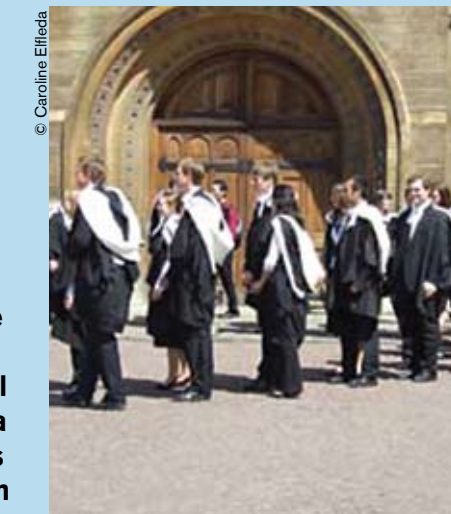
Cola para la obtención de títulos académicos en Cambridge (Reino Unido).

Dentro de un mismo país, algunos grupos de población no tienen las mismas oportunidades de acceso que otros a la educación superior. Las personas con ingresos bajos o