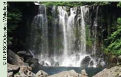
Cascadas de la reserva de biosfera de la Isla de Jeju (República de Corea).

El Consejo Internacional de Coordinación del Programa sobre el Hombre y la Biosfera (MAB) celebró su 21ª reunión entre el 25 y el 29 de mayo en la isla de Jeju (República de Corea).