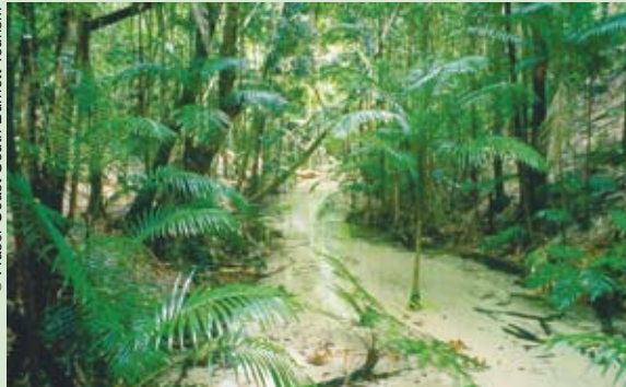
La Isla Fraser, sitio del patrimonio mundial, se ha convertido en la zona núcleo de la nueva reserva de biosfera de Great Sandy (Australia).