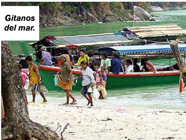
Gitanos del mar.

Para más seguridad, el nuevo poblado se está construyendo más lejos del mar.