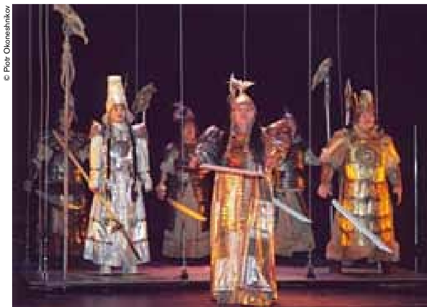
Una escena del espectáculo olonjo "Kyys Debilié".

Nutrida de las leyendas guerreras de la región y estrechamente vinculada al folclore de los chamanes, esta epopeya es depositaria de la memoria épica de la nación yakute.