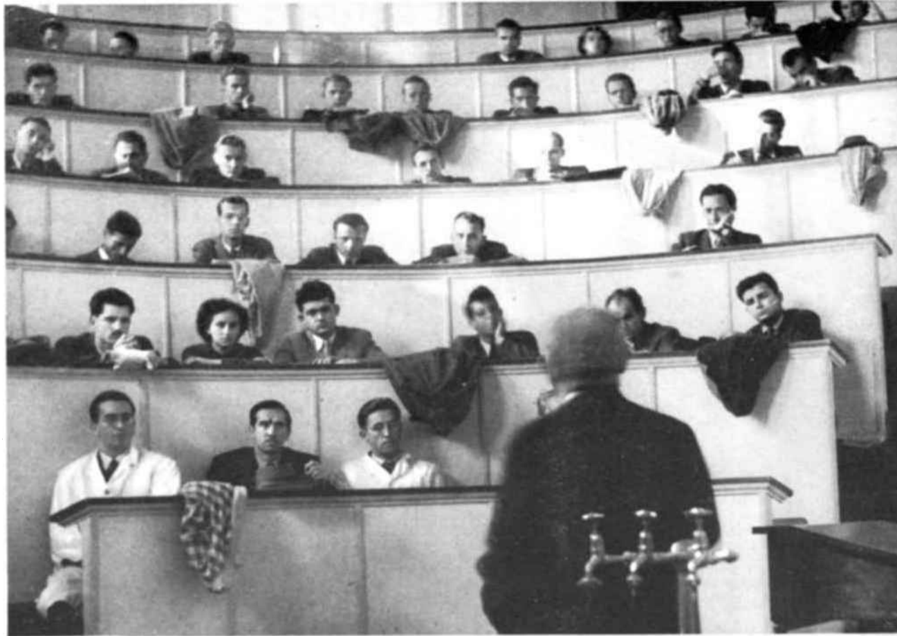
Esta foto ha sido tomada en la Universidad de Zagreb mientras dictaba clase el Profesor Andrija Stampar, conocido sociólogo (de espaldas).

Pero después de la caída de Napoleón, Eslovenia volvió a ser posesión del Imperio austro-húngaro y la enseñanza superior de la Universidad de Ljubljana se redujo de nuevo a lo que había sido antes de la administración francesa. Así siguió hasta 1848. En esa época, a pesar de que los eslovenos habían solicitado la apertura de una Uni-