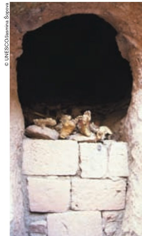
Cavidad en las rocas que circundan la célebre iglesia de San Jorge donde desbordan los pies de santos que reposan allí desde hace siglos.

Un poco apartada de este conjunto de iglesias entrelazadas en la ladera de una colina, Bet Giorgis (Casa de San Jorge), la única dotada de un sistema de drenaje, es probablemente la iglesia más reciente de las excavadas por orden del rey Lalibela. De lejos, se la ve aflorar de un inmenso foso, con su techo en forma de cruz griega. Uno se siente pequeño al pie de este edificio cruciforme con 12 fachadas de 12 metros de altura. Cornisas y ventanas delimitan desde el exterior