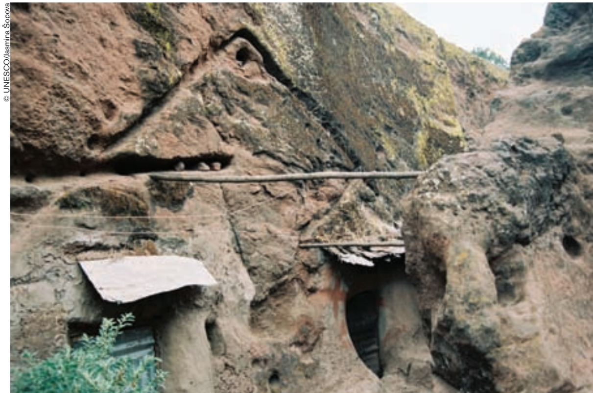
Lalibela: tras una iglesia puede esconderse otra.

La ciudad se llamaba Roha, "la maravillosa", cuando el muy piadoso rey Gebre Mesqel hizo excavar en la roca once iglesias monolíticas, comunicadas entre sí por un laberinto vertiginoso de túneles, con cavidades de las que a veces sobresale el pie de algún santo que reposa allí desde hace siglos.