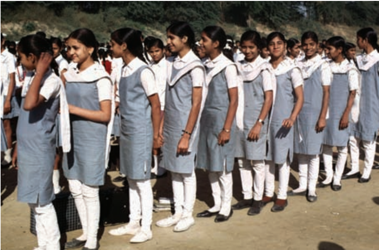
Escuela secundaria de Nueva Delhi.