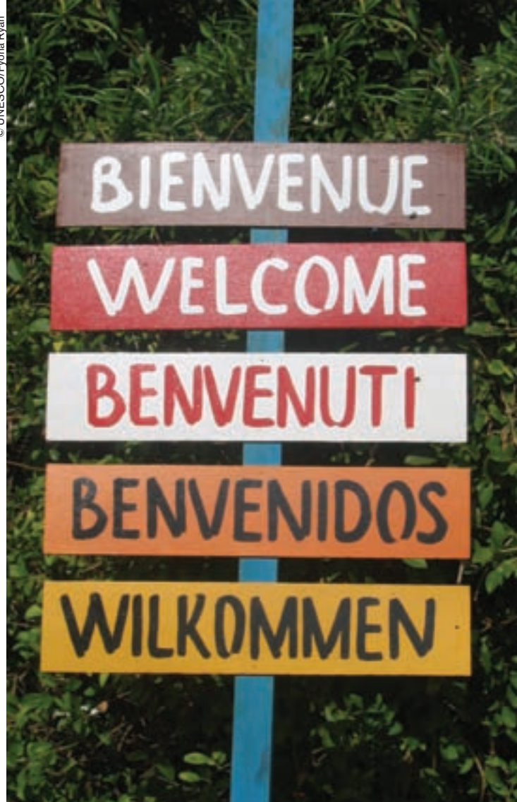
Cartel de bienvenida a la isla de Gorée, Senegal.