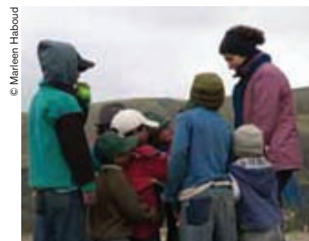
La transmisión de una lengua a los más pequeños es fundamental para su supervivencia.

aceleradamente. Esto implica no solamente la pérdida de términos o expresiones, sino de un cúmulo de conocimientos y de formas de concebir el mundo y de relacionarse con él, de recrear la historia, de mantener relaciones con otros seres humanos, con sus mayores y con las nuevas generaciones, de conceptualizar el tiempo, el espacio, a cada ser viviente, a la vida y la muerte. Cada lengua es un mundo, de modo que con cada voz que se pierde, desaparecen historias únicas e irremplazables.