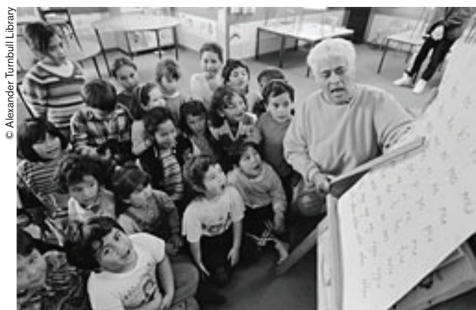
En Nueva Zelanda existen "nidos lingüísticos" donde se transmite la lengua maorí a los más jóvenes.

Personalmente, a la pregunta de por qué debemos preocuparnos por la preservación de las lenguas, yo respondería concisamente así: porque cada idioma es un universo mental estructurado de forma única en su género, con asociaciones, metáforas, modos de pensar, vocabulario, gramática y sistema fonético exclusivos. Todos esos elementos funcionan conjuntamente en el marco de una estructura que, por ser extremadamente frágil, puede desaparecer para siempre con suma facilidad.