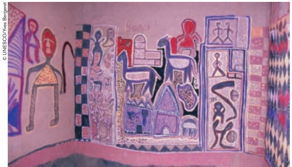
“Casas de pintores” en el pueblo dogón de Boni. A la derecha se aprecia el motivo de la serpiente.