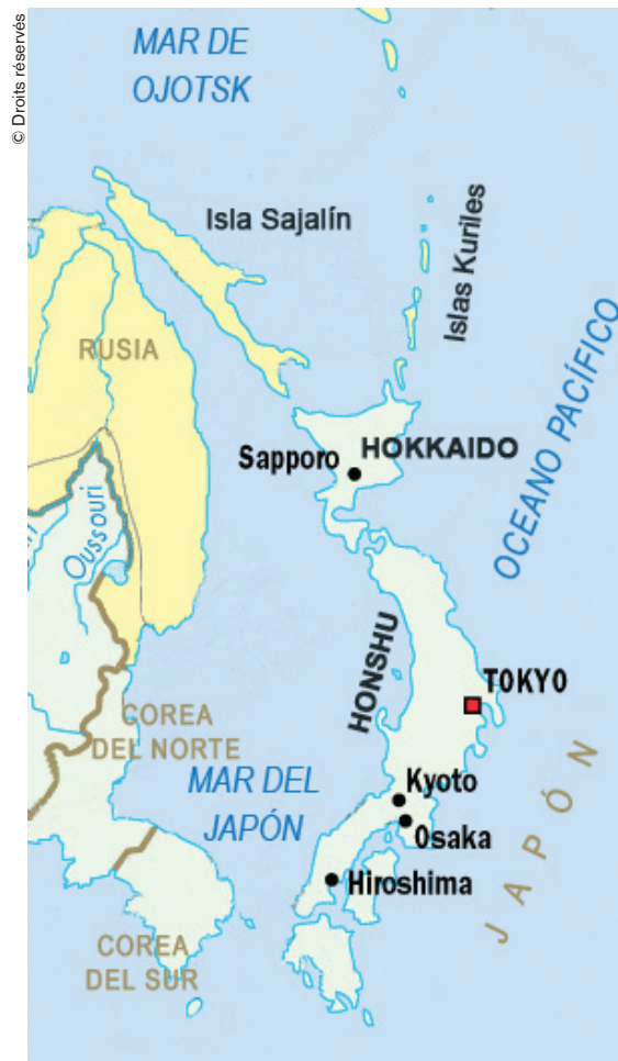
En el pasado, los ainu vivían en la parte septentrional del archipiélago japonés.