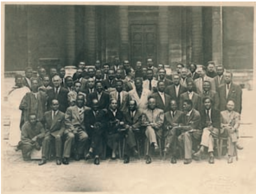
En 2006, la UNESCO participó en el Cincuentenario del Primer Congreso Internacional de Escritores y Artistas Negros. Foto de grupo de los participantes de 1956.