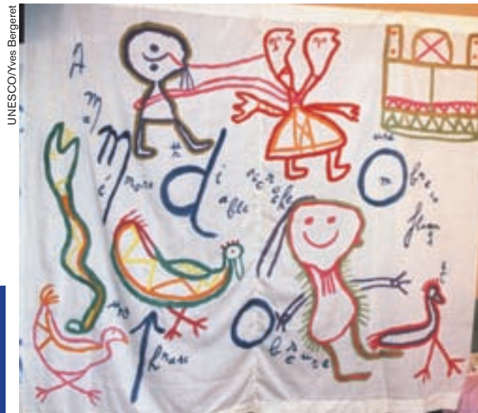
Según la tradición, la cobra es guardiana de la lengua toro tegu, que se habla en el territorio dogón (Mali).

La piedra es palabra mineralizada, el agua es palabra reidora, el grano plantado es palabra promesa: la lengua toro tegu, hablada en la actualidad por cinco mil dogón en el norte de Mali, concibe cada elemento de lo real como su parte integrante.