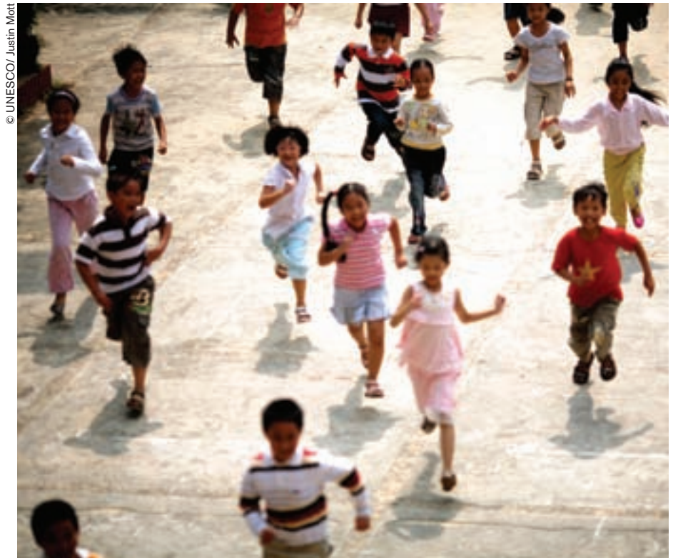
Privar al niño de la lengua materna en el hogar es crear una situación conflictiva entre el modelo familiar y el modelo social.

Los últimos veinte años de investigaciones en psicolingüística y sociolingüística demostraron sin