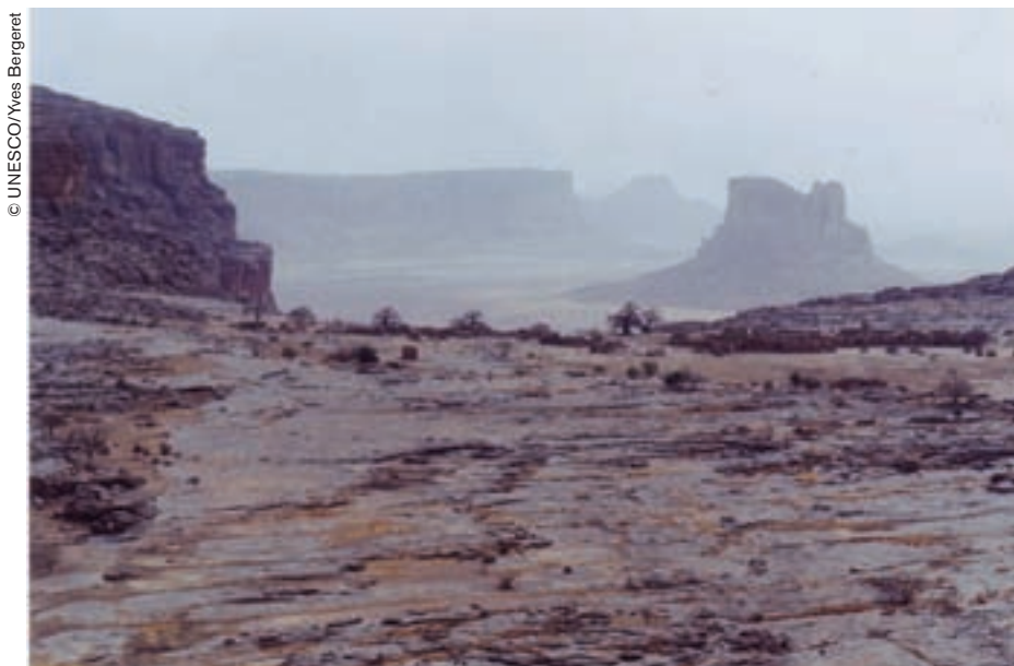
Para los habitantes de Koyo, la cima de la montaña encarna la palabra en toda su fuerza. El poder de la palabra se debilita a medida que se baja la pendiente.