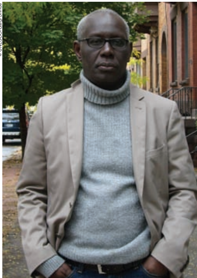
Boubacar Boris Diop.