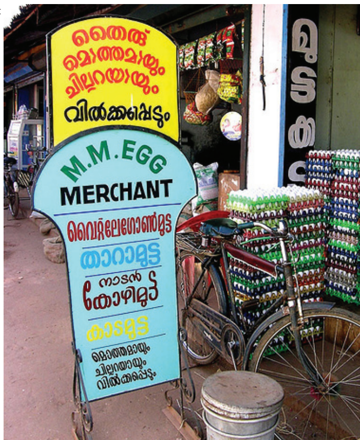
En publicidad, todos los idiomas sirven.

La Torre de Babel india tiene forma de pirámide y en su cúspide se hallan el hindi y el inglés, dos lenguas que son extranjeras para dos tercios de la población. Luego están las lenguas oficiales de los distintos Estados y territorios (lenguas regionales), seguidas por las lenguas minoritarias que están desprovistas de funciones administrativas, a pesar de ser habladas por más un millón de personas cada una. En la parte más baja de este imponente edificio hay centenares de lenguas más, por cuya situación vela un comisario encargado de las minorías lingüísticas, que carece de poder de decisión y sólo puede emitir dictámenes.