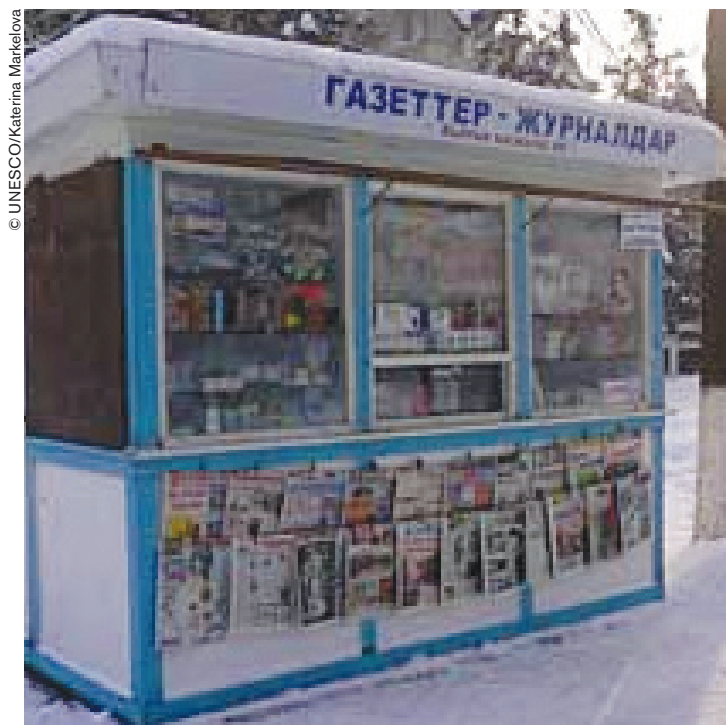
Quiosco de prensa en Bichkek, capital de Kirguistán.