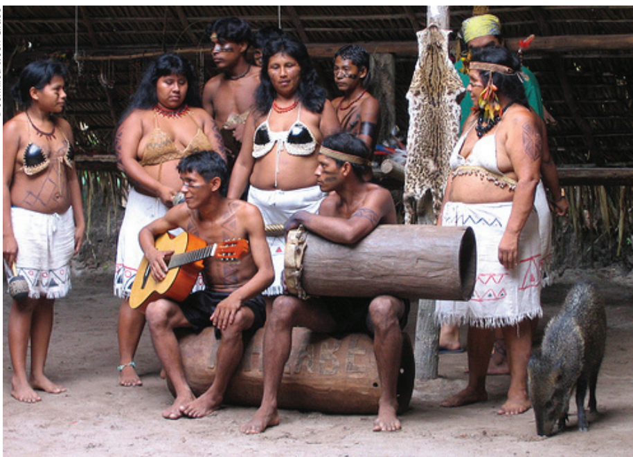
Amazonia (Brasil): varias lenguas indígenas están desapareciendo. Hasta mediados del siglo XVII, el tuli, por ejemplo, estaba tan extendido como el portugués.