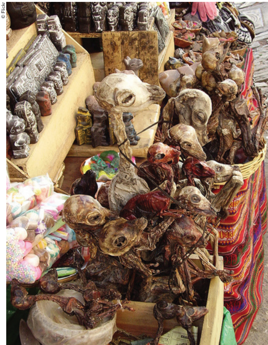
Mercado en el que los kallawayas adquieren sus productos. La Paz.