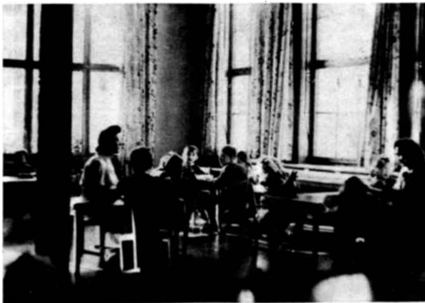
En el período de formación que comprende hasta los siete años de edad, la conciencia social del niño va desarrollándose lentamente. Es, en realidad, el primer esfuerzo de la personalidad por adaptarse al medio ambiente, reconociendo los derechos ajenos. Encauzado con habilidad, ese esfuerzo puede convertirse en un espíritu de tolerancia y comprensión, virtudes de las que el mundo anda cada día más necesitado. A ese objeto, muchas organizaciones no gubernamentales vienen trabajando en la actualidad con la Unesco, mejorando y extendiendo las aplicaciones de la educación pre-escolar.

La Asociación Internacional de Catedráticos y Ayudantes de Cátedra se ha puesto en relación con la UNESCO a fin de estudiar los diversos