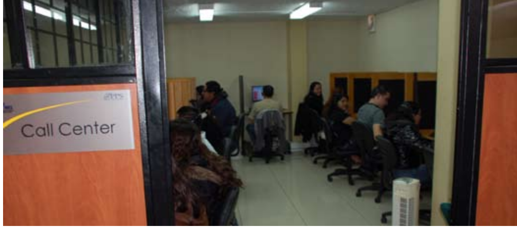
Oficina del Programa de Protección Social (PPS) que atiende a los beneficiarios del bono. Como esta oficina hay 22 en todo el país.

Algo de lo que es consciente Ligia Hernández, de 37 años, beneficiaria del