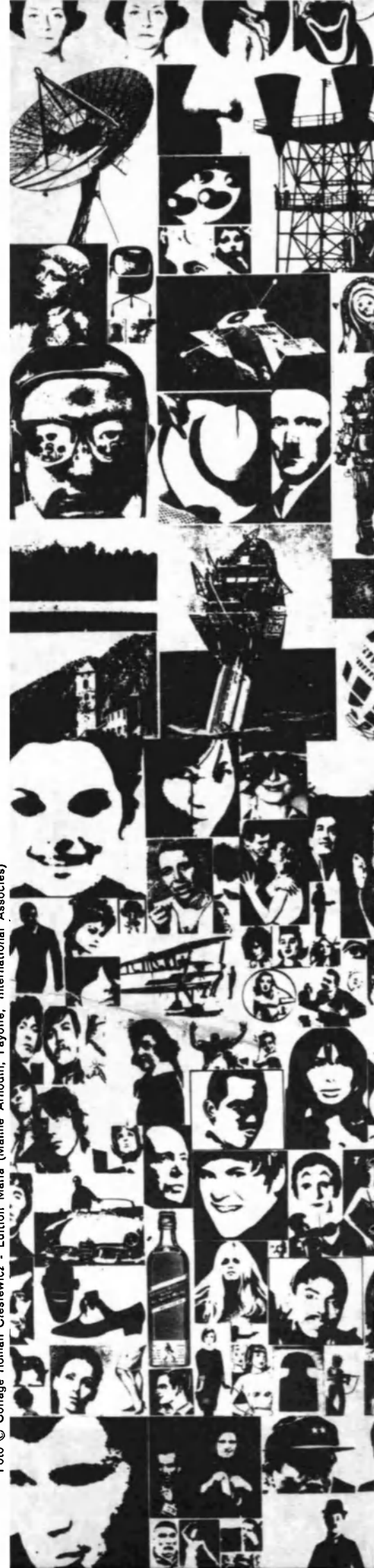
Foto © Collage Roman Cieslewicz - Edition Mafie (Maimé Arnodin, Fayolle, International Associés)

Como en un calidoscopio gigante, todas las imágenes del mundo —desde la belleza hasta el horror— estallan sobre la juventud actual, la primera que ha crecido frente a las pantallas de televisión. Para esta juventud la imagen está antes que la palabra. Ello modifica tanto su actividad como su capacidad de razonar, y ciertos sociólogos ven en las comunicaciones de masas la razón profunda de las crisis actuales, que son las de un humanismo que se está buscando.