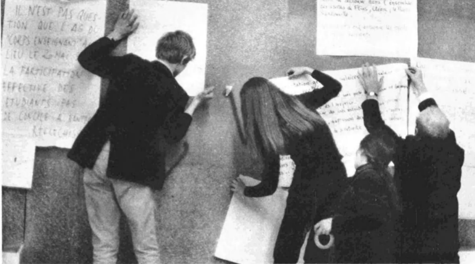
UNA JUVENTUD TRIDIMENSIONAL (cont.)