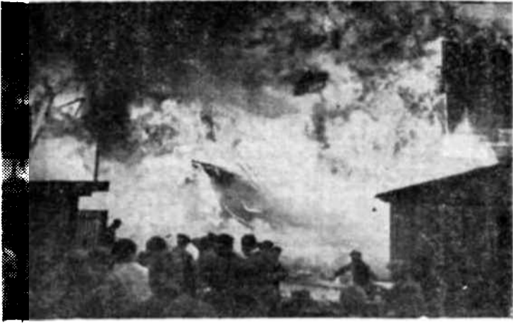
Un estudio cinematográfico checo destruido por el fuego. Los tres cuartos de los recursos en medios de información de masas han desaparecido en los países víctimas de la guerra.

Las encuestas de la Unesco han puesto de relieve las desigualdades existentes en el mundo en la distribución de los recursos materiales y técnicos de la información. Uruguay, por ejemplo, posee un aparato receptor por cada 7 habitantes, Birmania sólo posee un aparato por cada 3.400 y la India por cada 1.490 habitantes. Cada familia danesa es pro-