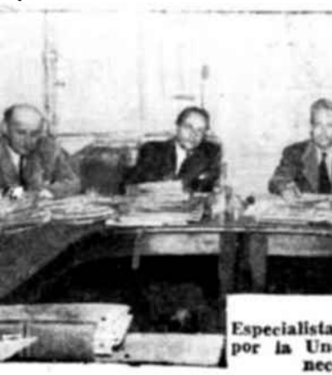
Especialistas de la Unesco por la necesidad...

En el campo de la ciencia, por ejemplo, los programas ofrecerán una discusión sóbriamente presentada de las posibilidades de fomentar los progresos científicos en dominios tales como la aplicación de la energía atómica a la industria, la prolongación de la vida humana, el tratamiento de las enfermedades mentales, el desarrollo de fuentes de energía para reemplazar los recursos que se agotan, la alimentación sinté-