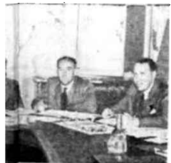
Destacados de la radio, reunidos para estudiar las deficiencias y necesidades de dicha industria.

Finalmente, el programa persigue la presentación de un cuadro equilibrado del hombre que trabaja en pro o en contra de sí mismo, describiendo por una parte, las desastrosas consecuencias de los conflictos, y por la otra, las casi ilimitadas posibilidades de progreso humano en el marco de un mundo pacífico y organizado.