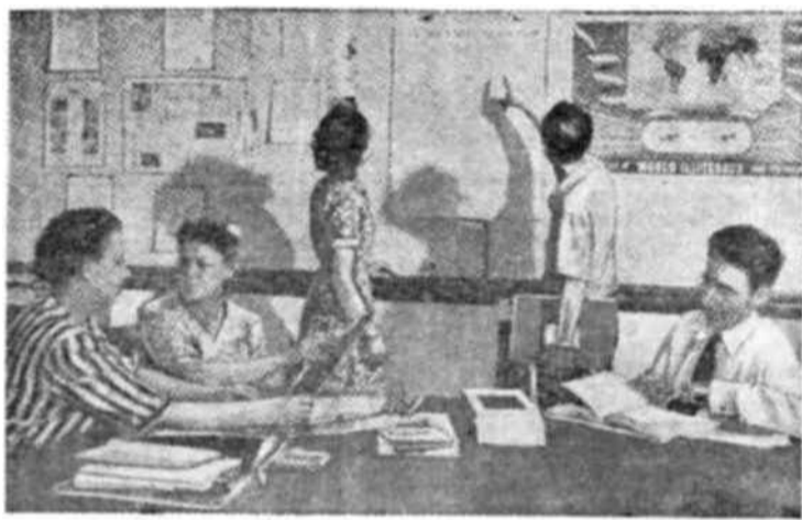
Educadores llegados de todos los países de la tierra confrontan sus opiniones sobre los métodos más adecuados para inculcar en las nuevas generaciones la conciencia de la solidaridad humana. La fotografía recoge uno de los momentos del Seminario de Adelphi College, Nueva York.