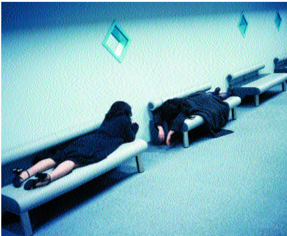
Recuperando energías tras un concierto de rock en Tokio.