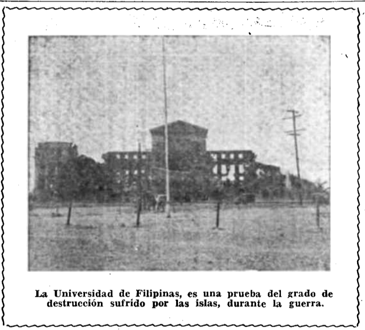
La Universidad de Filipinas, es una prueba del grado de destrucción sufrido por las islas, durante la guerra.

En todas partes el Director General fué recibido con la más calurosa simpatía y pudo asegurarse de la buena voluntad y del entusiasmo que provoca el trabajo de la Unesco.