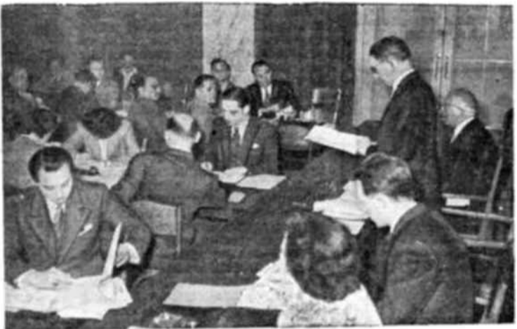
En la Conferencia de la Instrucción pública en Ginebra los países han expuesto sus avances de tipo escolar.

La Conferencia acordó por unanimidad rendir homenaje al pedagogo francés Marc-Antoine Julien (1775-1848), a quien se considera precursor de la técnica y organización de la pedagogía comparada.