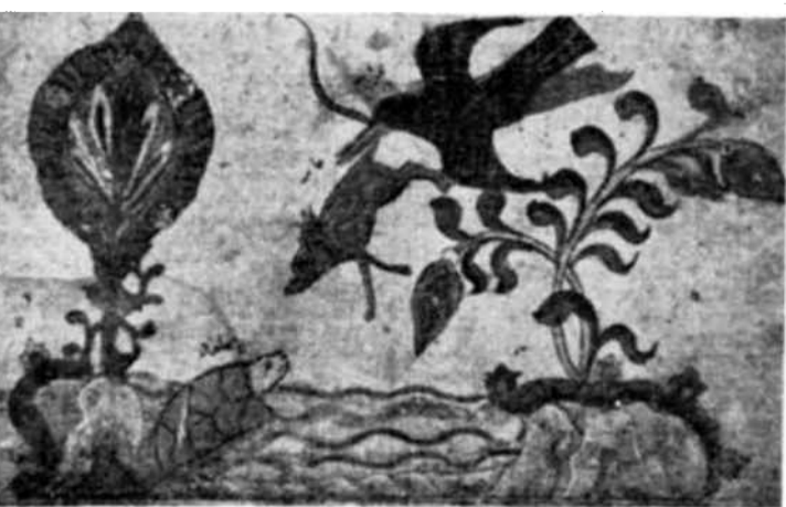
Una ilustración tomada de un viejo manuscrito persa "Bodpai Fable", que se conserva en la Biblioteca Nacional de París.