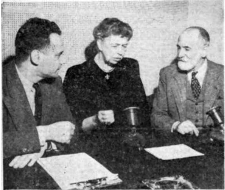
La Señora Eleanor Roosevelt y Mr. René Cachin, relatan sus impresiones ante el micrófono de las N.U.

IMPRIMERIE DU NEW YORK HERALD TRIBUNE 21, Rue de Berri - Paris 8e