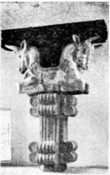
El museo del Louvre, conserva ejemplares magníficos del antiguo Oriente. La revista Museos, acaba de reproducir uno que procede de la galería de Suza, capital del Imperio de Agamenón.

Este papel desempeñado por los cristianos de lengua siríaca, representantes de los cuales encontramos en Beirut los miembros de la Unesco en maronitas del Líbano, en nada disminuye la importancia del mundo árabe en la transmisión de la herencia antigua. Sin él, el inmenso trabajo realizado por sus maestros, los sirios de Mesopotamia, se hubiera quedado en letra muerta, hundida en una lengua que apenas fué conocida en Occidente con anterioridad al Renacimiento del siglo XVI.