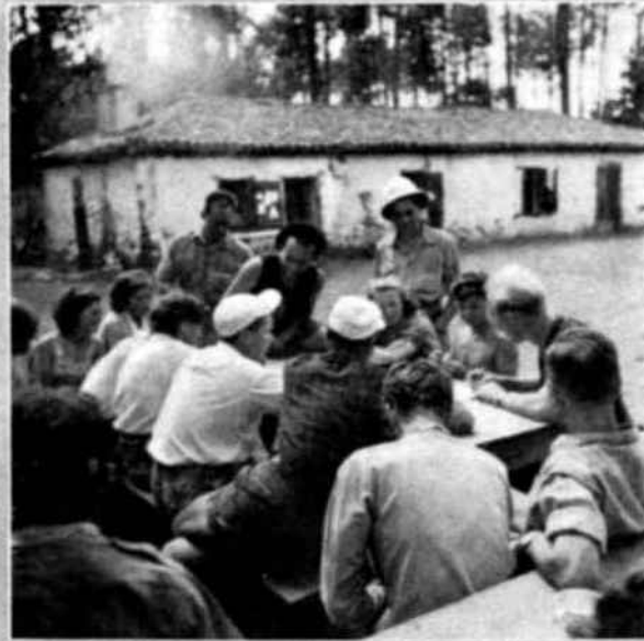
Ante la Maison des Filles los muchachos disponen su plan de trabajo. Aunque su jornada comienza a las seis de la mañana, consagran sus veladas a celebrar debates y estudios en común sobre los más diversos temas.