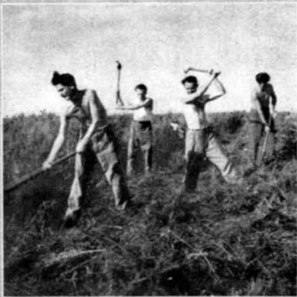
Estos voluntarios yugoslavos abren ranjas protectoras a fin de proteger los nuevos cultivos. El Ministerio de Agricultura ha decidido dedicar varios centenares de hectáreas al cultivo y pastoreo a fin de aislar los bosques.

Uno de los hechos más simpáticos de estos campos ha sido la amistad que pronto ligó a los jóvenes trabajadores con los propios habitantes de la región, quienes se vieron así transportados a un ambiente internacional que quizás haya servido a consolarlos de su infortunio.