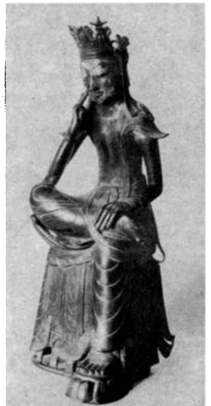
ESTATUILLA coreana que representa a un discípulo de Buda.

sistema de referencias habremos de atenarnos? Más allá del hambre y del miedo, ¿qué imágenes pueblan sus sueños? ¿Qué forma cobran sus pensamientos? Porque son sus pensamientos los que empiezan a prever el futuro y a querer crearlo, y no podrán hacerlo extrayéndolo de la nada: habrán de