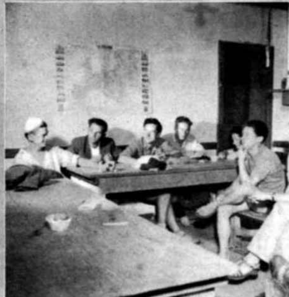
De regreso al Campo, tras una larga jornada de trabajo, los jóvenes voluntarios de Saugnac charlan de sus países, profesiones y esperanzas. Una obra filantrópica, la recuperación de las Landas, ha unido sus vidas este verano; pero muchos de ellos proseguirán la amistad aquí entablada.