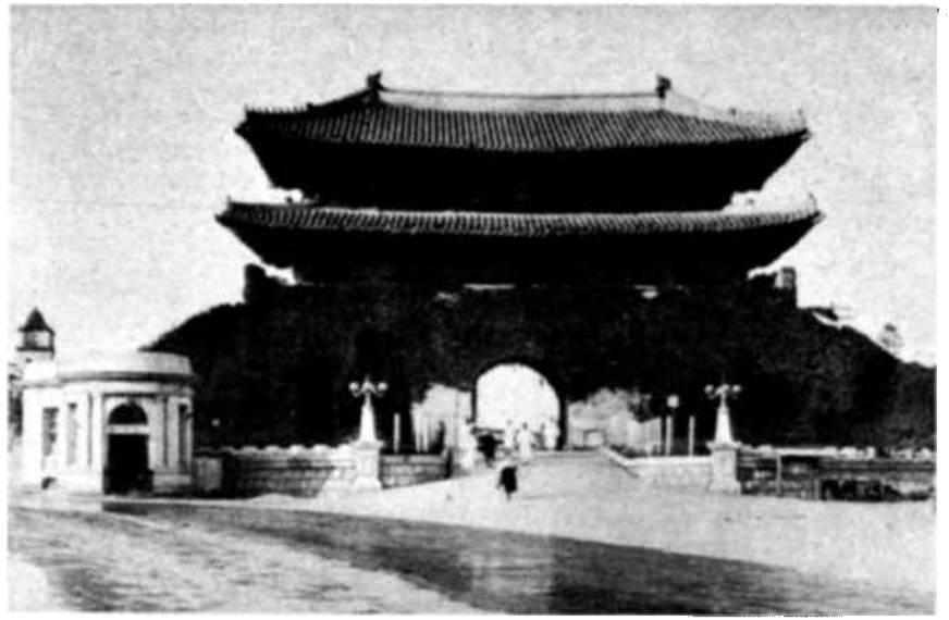
LA PUERTA DEL SUR EN SEUL. El primer Rey de la dinastía Yi reclutó a doscientos mil obreros para construir una gran muralla en torno a Seúl, su nueva capital. Dicha muralla tenía doce kilómetros de larga, seis metros de ancha y de tres a seis metros de alta; poseía cuatro puertas grandes y cuatro pequeñas. Aun pueden verse hoy los restos de la misma dentro de la ciudad, que rebasó ya el millón de habitantes.

Y a propósito de pueblo, ¡qué murallas en torno suyo! Mas los geógrafos y los historiadores no acostumbran, a menos que sean poetas, reparar en esas menudencias. Claro está que nos han descrito las cabañas del campesino coreano, y las ceremonias nupciales y algunos bailes religiosos y las tradiciones culinarias. El viajero, por lo general, no tiene en cuenta la pintura que haría de sí mismo si tuviera que limitarse a describir su manera de dormir, de comer o de casarse. Otros curiosos, no obstante, nos han transmitido algunos proverbios: en ellos reside la sabiduría de las naciones. He aquí el folklore: los apólogos y los cuentos de hadas. La Cenicienta se llama Konhji; Caperucita Roja será devorada por el tigre. Este parece tan importante en Corea como en China; y los genios desempeñan un papel semejante a los