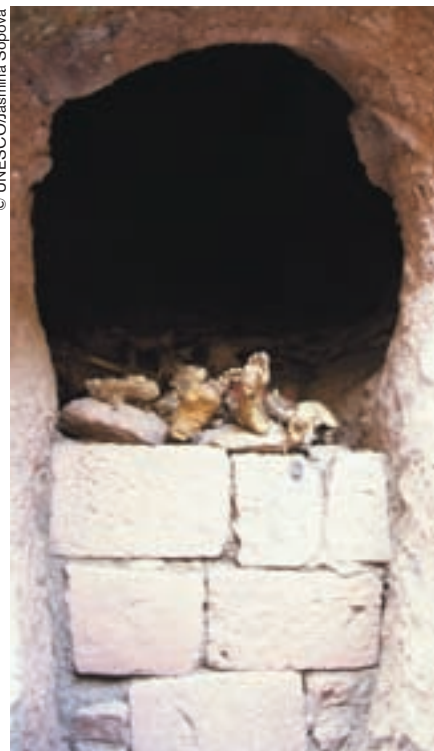
Cavidad en las rocas que circundan la célebre iglesia de San Jorge donde desbordan los pies de santos que reposan allí desde hace siglos.