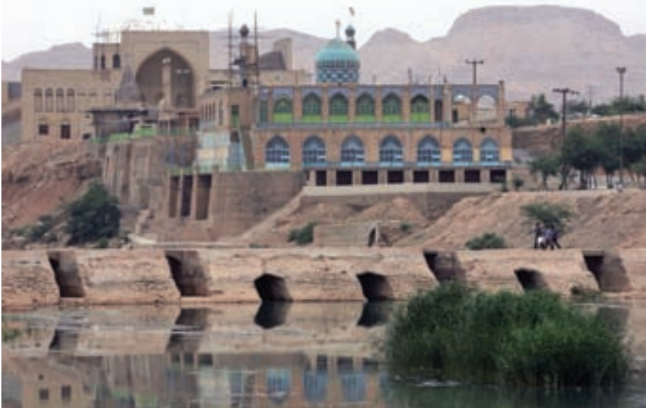
La presa de Band-e Miza en Khuzistán (Irán) forma parte del sistema hidráulico histórico de Shusta, inscrito en la Lista del Patrimonio Mundial.

La Convención de 1972 sobre la Protección del Patrimonio Mundial Cultural y Natural constituye sin duda alguna el instrumento internacional más ampliamente reconocido y el más eficaz en materia de preservación. Uno de sus principales objetivos es "identificar, proteger, conservar, revalorizar y transmitir a las generaciones futuras el patrimonio cultural y natural". Es decir que, cuando un sitio ingresa en la Lista, el proceso no termina allí sino que acaba de comenzar.