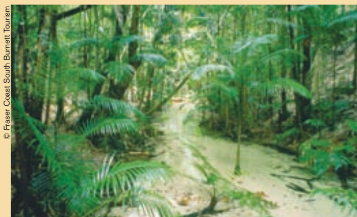
La Isla Fraser, sitio del Patrimonio Mundial, constituye el núcleo de la nueva reserva de biosfera de Great Sandy.

L as reservas de biosfera y los sitios del Patrimonio Mundial tienen que afrontar problemas en común derivados del cambio climático y del deterioro o la pérdida de biodiversidad. Para resolverlos, es imprescindible mejorar la colaboración estratégica y la coordinación de actividades entre el Programa sobre el Hombre y la Biosfera (MAB) y la Convención del Patrimonio Mundial, con vistas no sólo a mejorar la gestión de los 85 sitios que comparten en común la Red de Reservas de Biosfera y el Patrimonio Mundial, sino también a combinar los distintos mecanismos y enfoques de ambos instrumentos, utilizándolos como elementos complementarios en beneficio de las poblaciones locales y del medio ambiente.