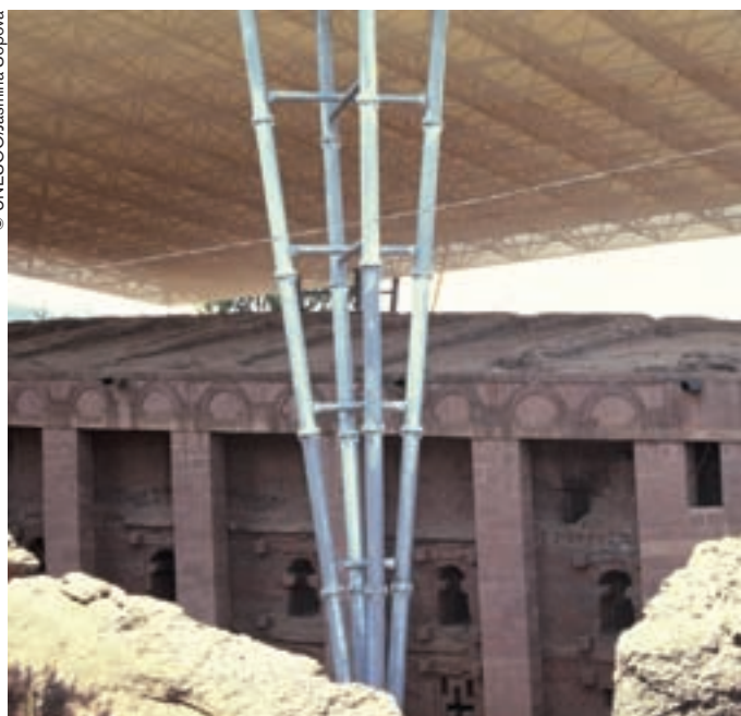
Betha Medhane Alem, la iglesia más grande de Lalibela bajo una moderna techumbre de protección.