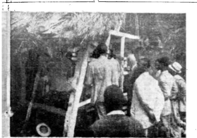
Una choza escuela en Haití.

(De la revista francesa "Presence Africaine", No 1, noviembre-diciembre 1947.)