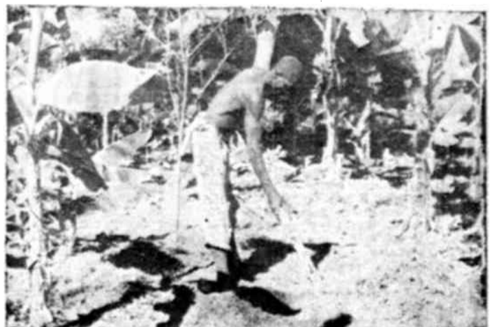
En Haití se emplea todavía la reja primitiva.