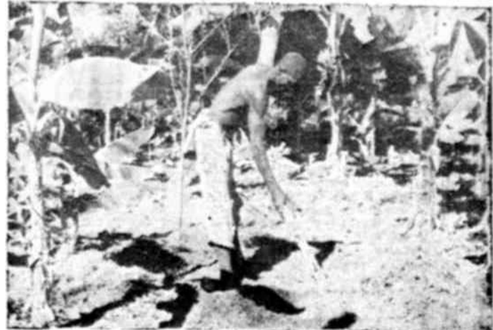
En Haití se emplea todavía la reja primitiva.

N. de la R. — El artículo que precede resume un informe presentado por el Dr. Métraux a la Unesco en el mes de marzo, con anterioridad a su salida para Haití.