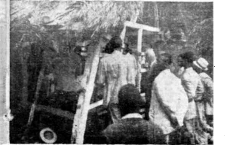
Una choza escuela en Haití.

(De la revista francesa "Presence Africaine", No 1, noviembre-diciembre 1947.)