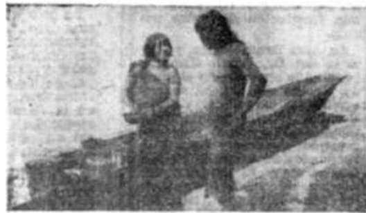
Familia india en los bancos del Amazonas.

De amor y de respeto al indio. Si no, toda obra sería inútil.