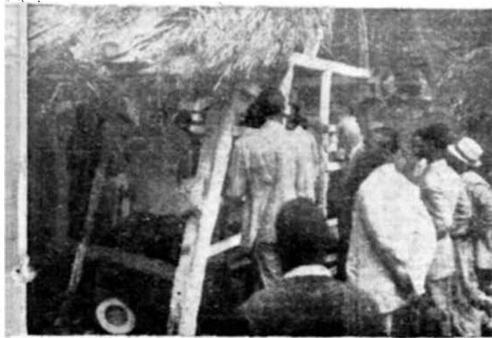
Una choza escuela en Haití.

(De la revista francesa "Presence Africaine", No 1, noviembre-diciembre 1947.)