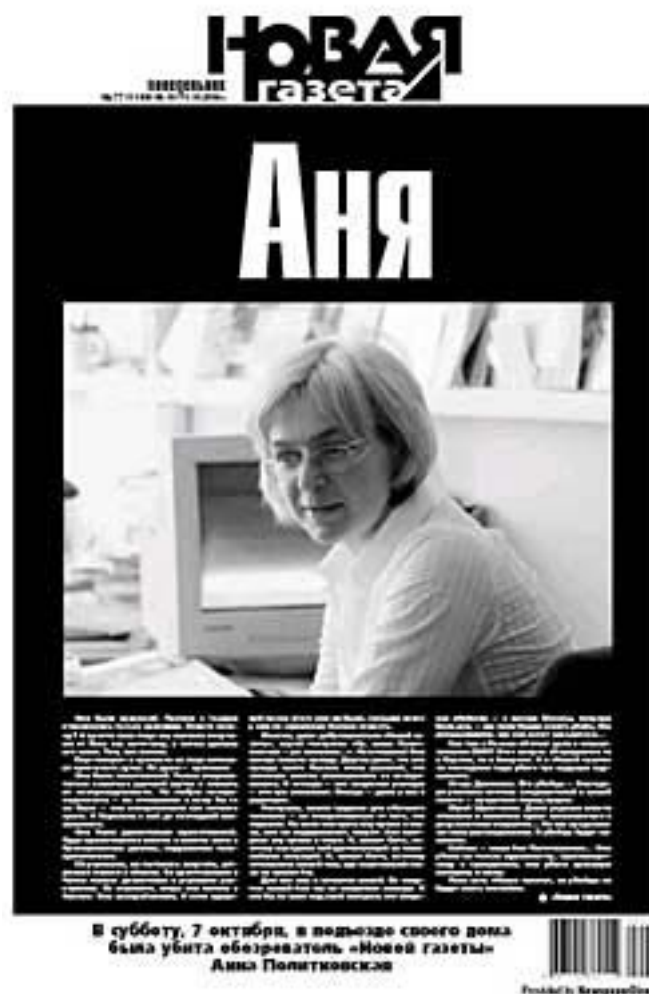
“Novaya Gazeta”, periódico en el que trabajó Anna Politkovskaya.