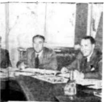
Destacados de la radio, reunidos para estudiar las deficiencias y necesidades de dicha industria.

Finalmente, el programa persigue la presentación de un cuadro equilibrado del hombre que trabaja en pro o en contra de sí mismo, describiendo por una parte, las desastrosas consecuencias de los conflictos, y por la otra, las casi ilimitadas posibilidades de progreso humano en el marco de un mundo pacífico y organizado.