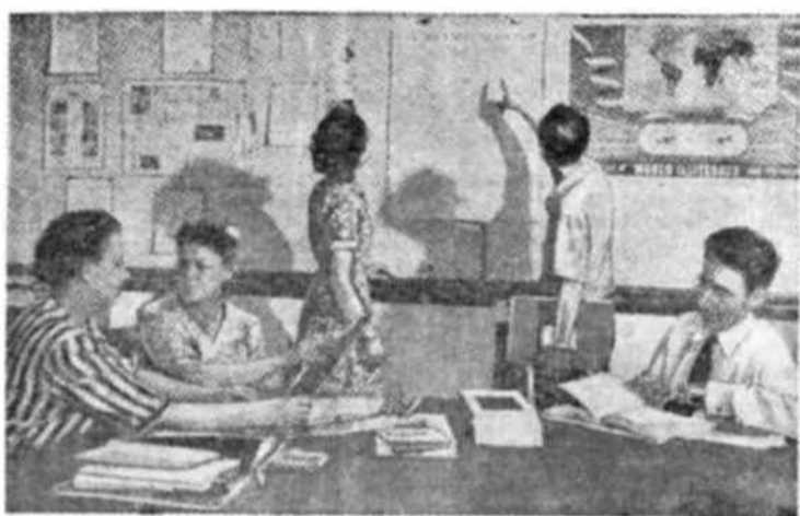
Educadores llegados de todos los países de la tierra confrontan sus opiniones sobre los métodos más adecuados para inculcar en las nuevas generaciones la conciencia de la solidaridad humana. La fotografía recoge uno de los momentos del Seminario de Adelphi College, Nueva York.