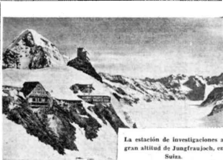
La estación de investigaciones a gran altitud de Jungfrauoch, en Suiza.

El plan que la Unesco prepara actualmente se espera que servirá, para contribuir a sistematizar y coordinar los encargos de material de las regiones devastadas por la guerra.