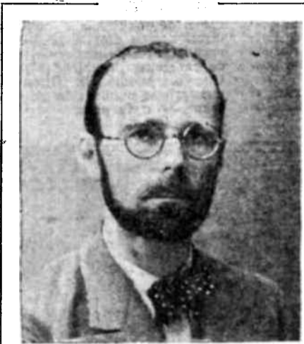
El Profesor Pierre Auger, Director de la Sección de Ciencias Exactas, fisicoquímicas y naturales de la Unesco, fué, desde abril 1945 hasta su nombramiento en la Unesco, Director de Enseñanza Superior del Ministerio de Educación Nacional de Francia. Físico eminente, el Dr. Auger es autor de muchas obras científicas sobre los rayos X, neutrones y rayos cósmicos.

En todos estos casos es necesario guiar y coordinar las fuerzas de cooperación y de comprensión del mundo entero, que no pueden encontrar por sí solas los medios