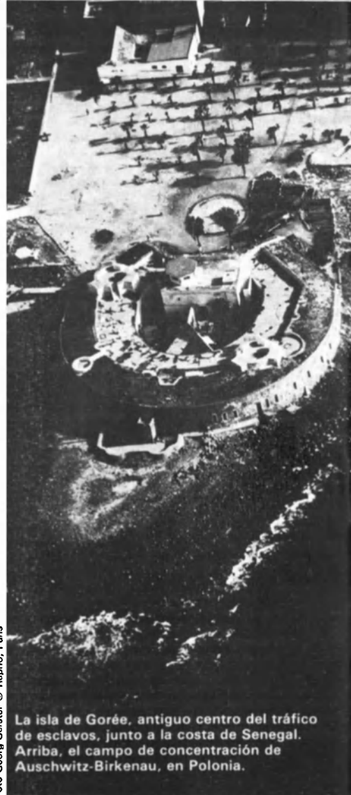
La isla de Gorée, antiguo centro del tráfico de esclavos, junto a la costa de Senegal. Arriba, el campo de concentración de Auschwitz-Birkenau, en Polonia.