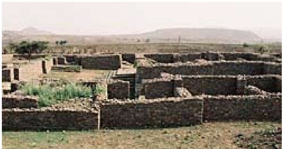
Vista panorámica del palacio de Dungur.

Pero, sin duda, la más elocuente es la “piedra de Rosetta” local. En la actualidad, se halla en un pequeño edificio construido especialmente para su salvaguarda, junto a una pista escarpada y sinuosa, a cierta distancia del centro de la ciudad. Descubierta por unos pastores en 1982, relata en tres lenguas (griego, ge’ez y sabeano, la lengua del reino de Saba) la campaña nubia de Ezana, último rey pagano y primer rey cristiano de Axum, que se convirtió al cristianismo hacia mediados del siglo IV y llevó el imperio a su