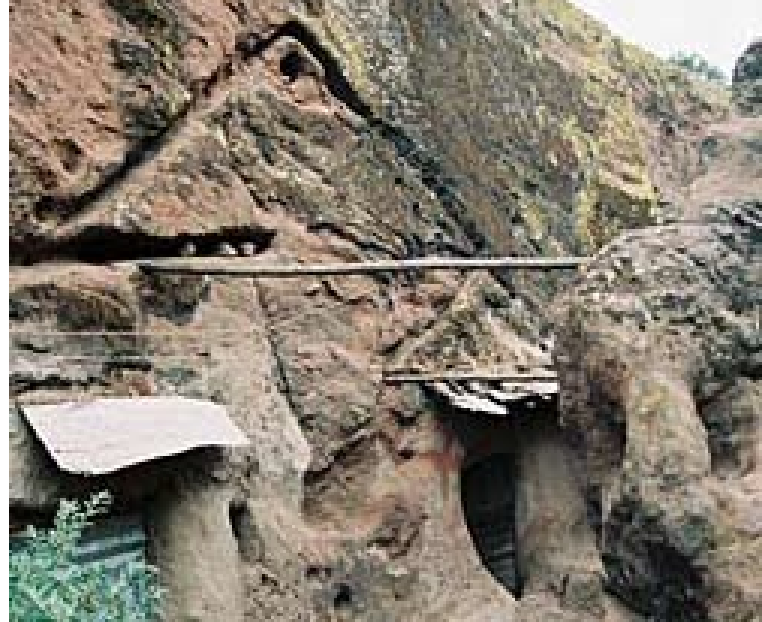
Lalibela: tras una iglesia puede esconderse otra.

Según una de las numerosas y controvertidas leyendas en torno al rey Lalibela, fue a su regreso del exilio en Jerusalén cuando fundó Roha, destinada a convertirse en una nueva ciudad santa en África.