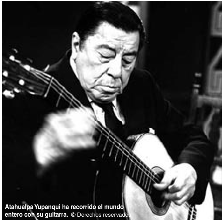
Atahualpa Yupanqui ha recorrido el mundo entero con su guitarra.