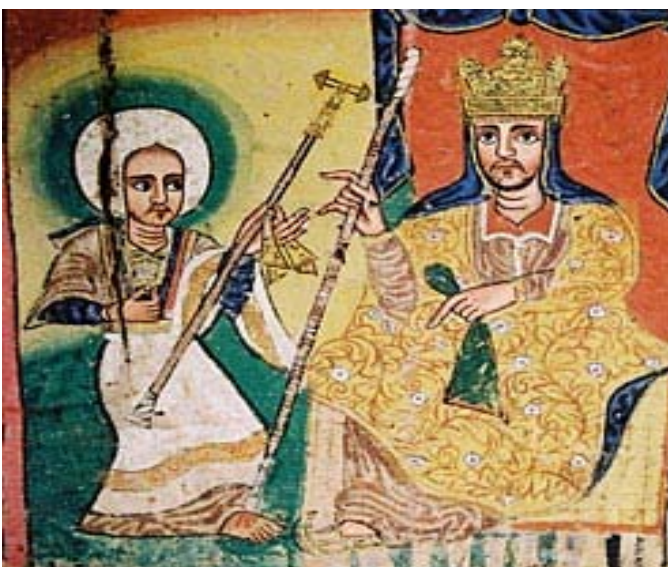
Yered y el rey. Detalle de una pintura mural de la iglesia Azuwa Maryam (lago Tana).

A sus pies, un “cómic” narra una historia sangrienta: “Este es Balaesam. Tres demonios lo han transformado en caníbal y se ha comido a 78 personas”, explica Wedu, señalando a un mons-