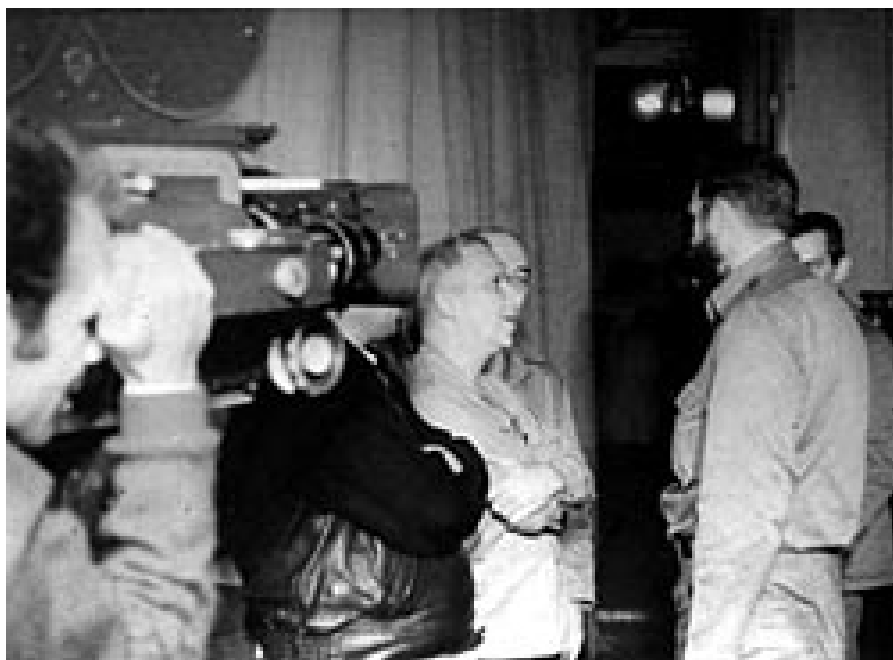
Santiago Álvarez y Fidel Castro, durante el rodaje de un Noticiero: los privilegios de una intimidad amistosa.