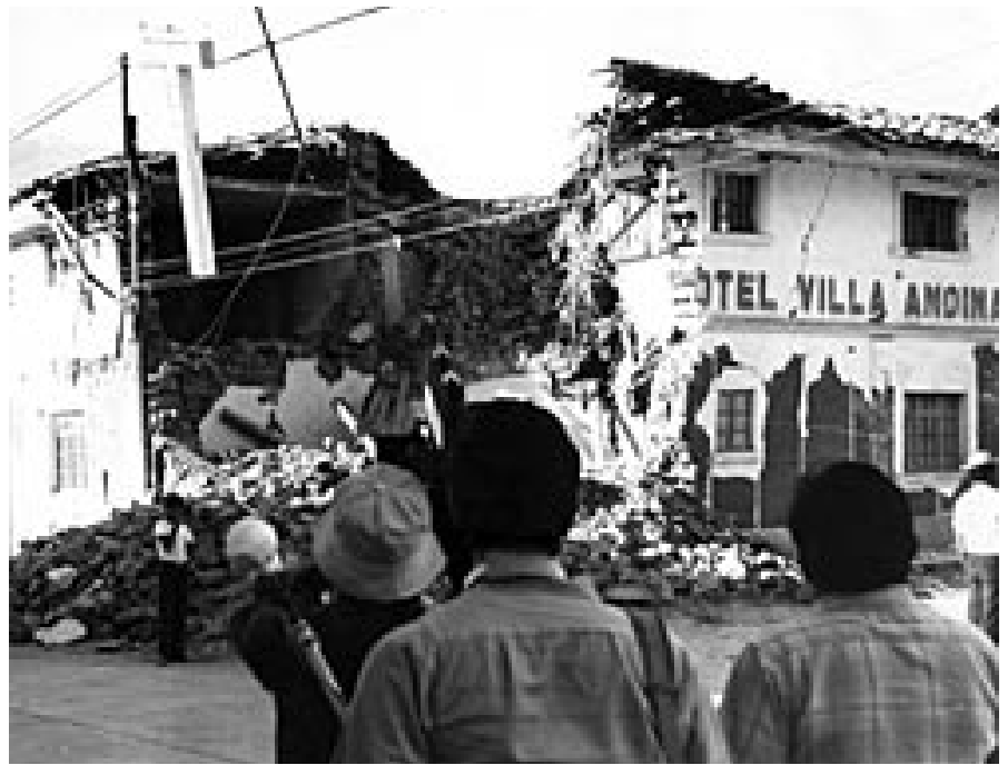
Un equipo del Noticiero rueda el terremoto en Perú (1970).

Tuve entonces la idea de crear un taller de salvaguardia de este patrimonio en el seno de la EICTV, que reúne todas las condiciones necesarias para llevar a cabo un proyecto de esa naturaleza. Por una parte, algunos de sus profesores trabajaron en la producción de las películas ahora en peligro, por lo que su destino les interesa muy particularmente. Por otro lado, la escuela dispone de la infraestructura y los equipos