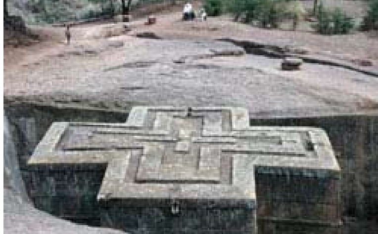
Bet Giorgis (Casa de San Jorge), una de las iglesias más fascinantes de Lalibela (Etiopía).

Bien es verdad que el patrimonio material y el inmaterial son indisolubles, sobre todo en Etiopía. Este es uno de los motivos que han inducido a Françoise Rivière a poner en marcha una