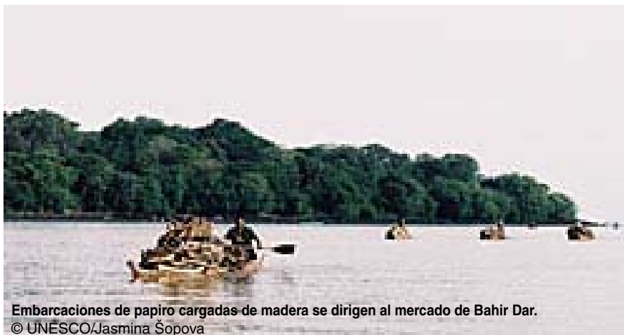
Embarcaciones de papiro cargadas de madera se dirigen al mercado de Bahir Dar.

“Existen cientos de iglesias por aquí”, afirma Wedu, con un significativo