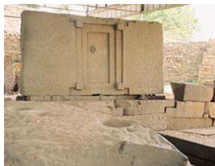
Tumba de la puerta falsa, en Axum.

La leyenda cuenta que una reina, cuyo nombre se desconoce, pero a la que se llama Guedit (la monstruosa) o Esato (la destructora), personaje histórico del siglo X, invadió Etiopía en busca del Arca de la Alianza, un cofre sagrado que contenía las tablas de los diez mandamientos. Al no hallarlo, la reina destruyó en un arrebato de ira toda la ciudad y puso fin así al imperio axumita. En recuerdo de este triste acontecimiento,