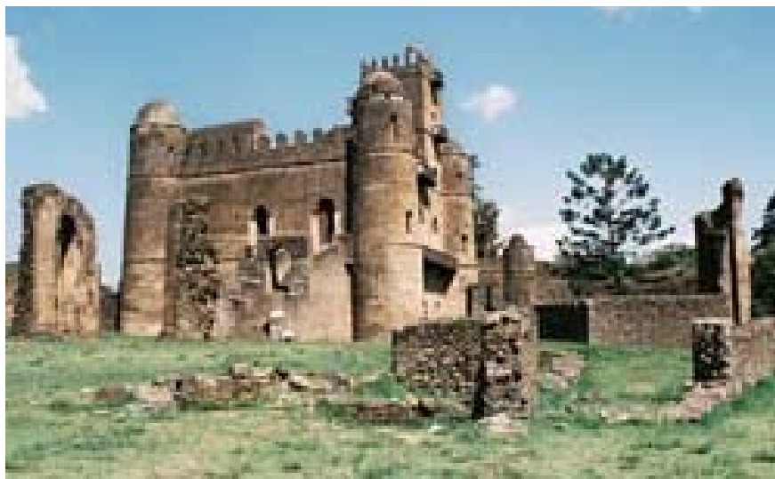
El palacio de Fasilidas.