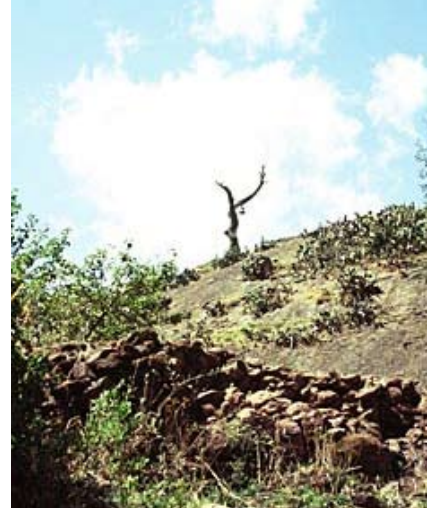
Pequeña colina en Lalibela, llamada Monte Tabor, lugar de la transfiguración de Cristo, en Galilea.

Detrás de la iglesia, los restos de su arquitecto yacen directamente sobre el piso, envueltos en paños multicolores, cerca del sarcófago del rey santo y de la tumba de su santa esposa, que no le dio hijos. "Su unión fue puramente espiritual", dice el sacerdote, antes de emprender el relato de un episodio increíble de la vida de ese rey. Imrahana Kirstos recibía a diario la visita de los arcángeles Gabriel y Rafael, quienes le proporcionaban alimento para los 5.740 peregrinos que afluían de todo el mundo para admirar su obra y su