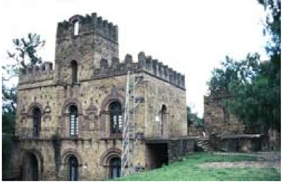
El palacio de la reina Mentaweb es actualmente un centro cultural y artesanal.

Cuando Fasilidas hizo construir su palacio en esta ciudad protegida por