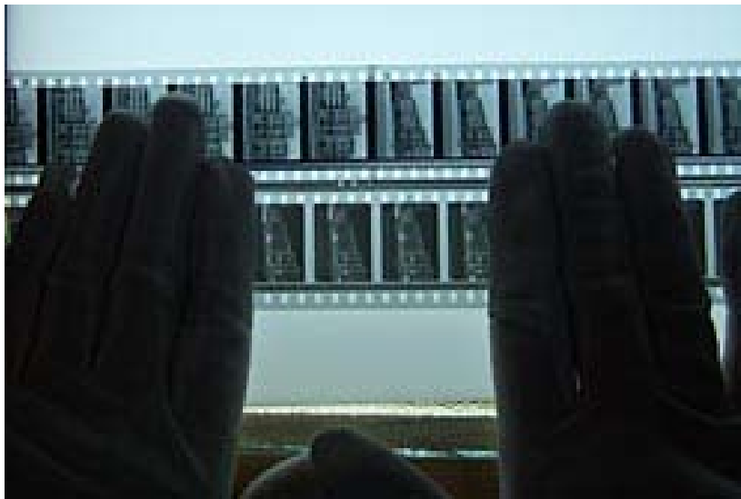
Comparación entre un filme negativo y uno positivo de un Noticiero, estudiado durante el Taller sobre Preservación Fílmica en Cuba.

Más tarde, en 1986, cuando el escritor colombiano Gabriel García Márquez (Premio Nobel de 1982), acompañado de Fidel Castro, inauguró en nombre de la Fundación del nuevo cine latinoamericano, la Escuela Internacional de Cine y TV (EICTV), en San Antonio de los Baños