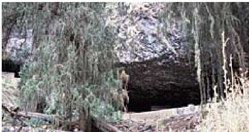
La iglesia de Imrahana Kirstos se oculta en un paisaje natural sorprendente.

¿Qué ocurrió en esta gruta? ¿A qué época pertenecen esos restos humanos? Las respuestas siguen siendo imprecisas. Pero se diría que en Lalibela basta un paso para pasar de lo imaginario a lo real. ■