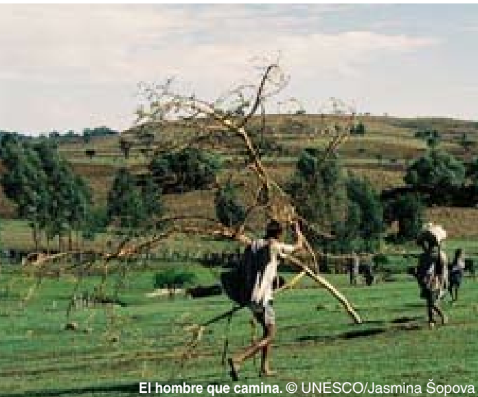
El hombre que camina.

Una silueta filiforme se recorta sobre el horizonte. Un hombre camina, descalzo. Nos recuerda las esculturas de Giacometti (Suiza), sólo que éste carga sobre sus espaldas un árbol entero. Un árbol muerto, con las ramas ahorquilladas, como retorcidas de dolor. Su tronco blanco contrasta con la piel oscura del hombre. No se detiene ni un instante para recobrar el aliento, avanza tan rápido que hay que correr para darle alcance. ¿A dónde va cargando con ese árbol más grande que él?