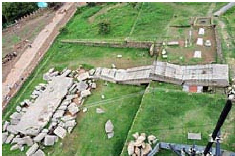
El mayor monolito jamás esculpido por el hombre (33m) yace al lado de una gran losa de piedra de 360 toneladas de peso.

la basílica Santa María de Sión, que según se dice alberga aún la famosa Arca, no acepta la entrada de ninguna mujer.