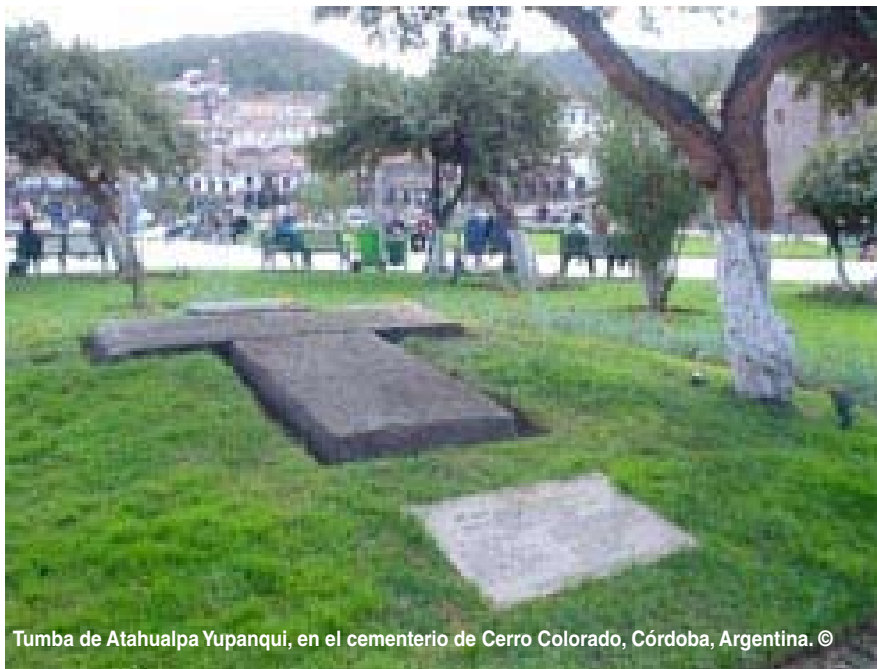
Tumba de Atahualpa Yupanqui, en el cementerio de Cerro Colorado, Córdoba, Argentina.

Cuando preparé mi programa sobre Atahualpa, me encontré con personas que lo habían conocido y frecuentado. El pianista argentino Miguel Angel Estrella [Embajador de Buena Voluntad de la UNESCO] recordó durante nuestra entrevista que su amigo Atahualpa solía visitarlo en su departamento parisino, se paraba al lado del piano y