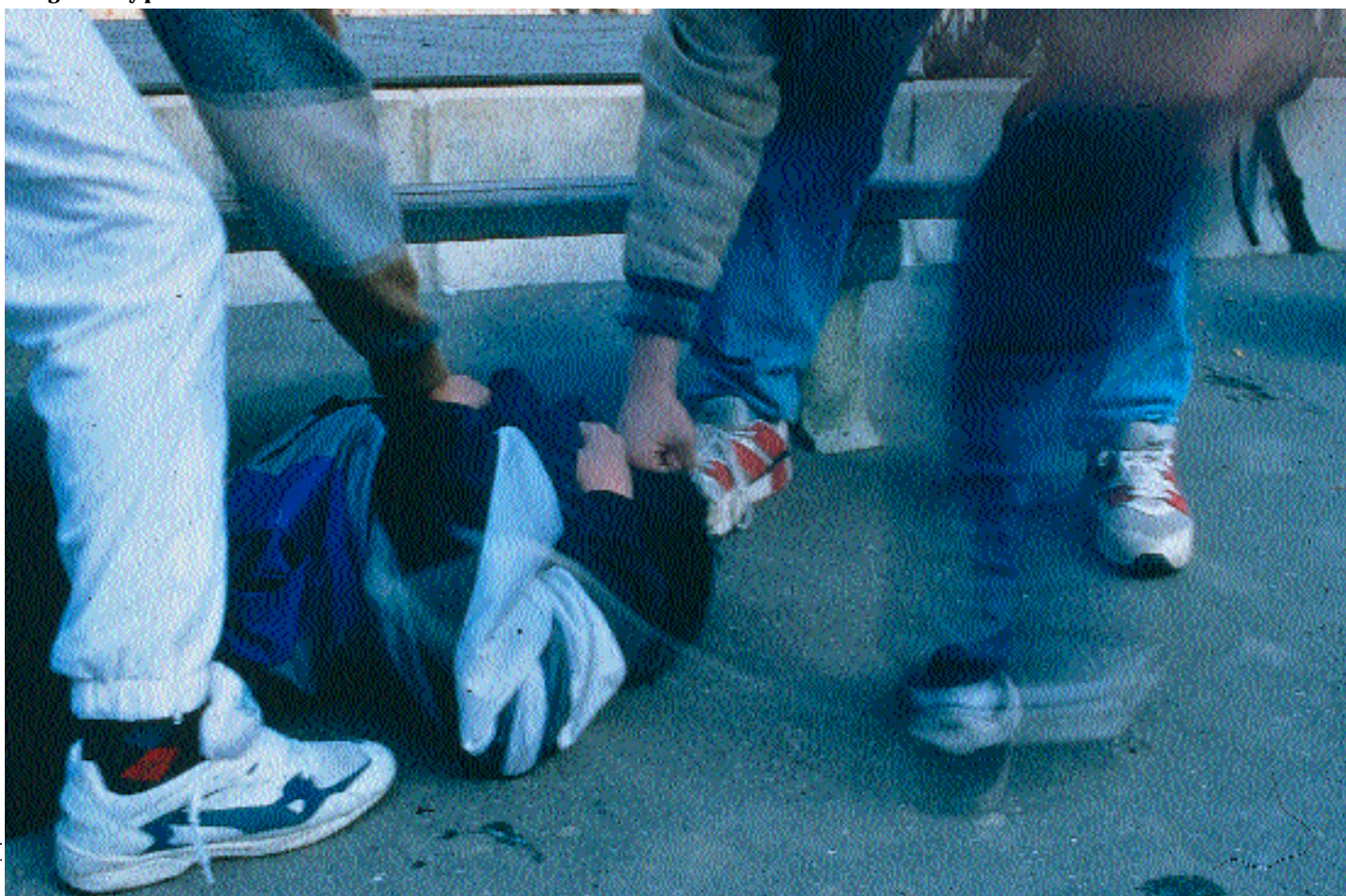
Las agresiones y peleas entre alumnos enturbian a menudo la buena marcha de los cursos escolares.

"El control de la disciplina en las escuelas", Revista Perspectivas . Vol. XXVII n° 4, diciembre de 1998. Oficina Internacional de la Educación, Unesco. Programa SAVE: Universidad de Sevilla. Facultad de Psicología. Dpto. de Psicología Evolutiva y de la Educación San Francisco Javier, s/n 41005 Sevilla, España. Correo electrónico: ortega@cica.es