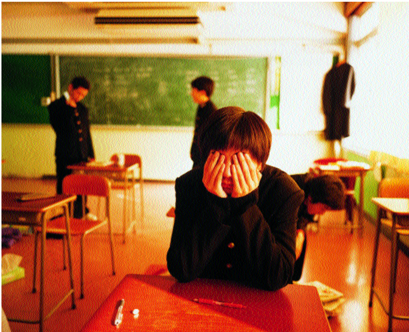
Un alumno agotado al término de una larga jornada de clase, Escuela Agrícola de Hanamaki.