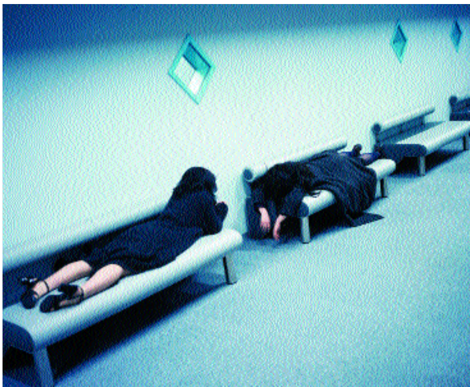
Recuperando energías tras un concierto de rock en Tokio.