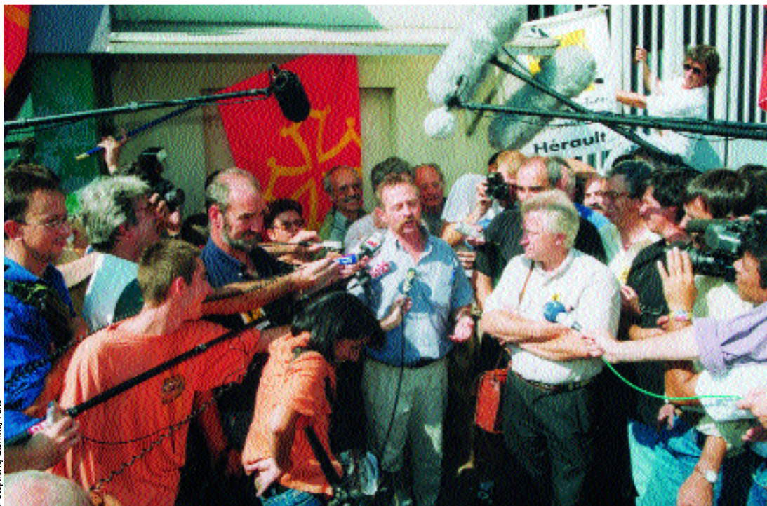
“Los medios van a reflejar cada vez más todo lo que sucede en la sociedad debido a la aparición de múltiples redes de información alternativa.” En la foto, José Bové, líder de la Confederación Francesa de Agricultores, haciendo declaraciones a la prensa.

► el fondo, la acción más directa de estos movimientos consiste en cambiar los valores de que está impregnada esa opinión y en obligar, al mismo tiempo, a las fuerzas políticas tradicionales y a los gobiernos a tenerlos en cuenta y apropiarse de ellos, incluso a costa de algunas deformaciones, pues esos movimientos utilizan los nuevos valores como una especie de moneda de cambio en la competición que libran las fuerzas políticas a través de las elecciones: haga suyos esos valores y haremos campaña en su favor.