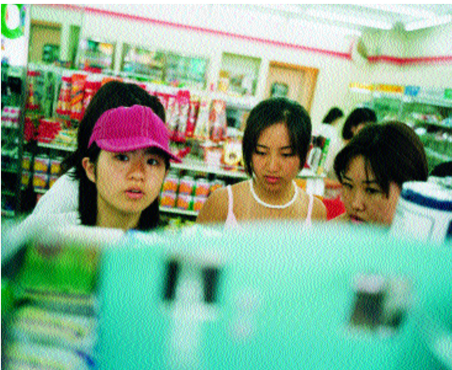
Jóvenes de compras en un supermercado de Tateyama.

► ficaciones precisas y un saber inmediatamente utilizable. A mi juicio, menos del cinco por ciento de los jóvenes han entendido lo que la sociedad espera de ellos y buscan realmente una educación que les brinde la preparación indispensable. Que el Japón resurja o se derrumbe en el futuro dependerá de que este porcentaje disminuya a tres o aumente a ocho.