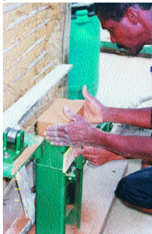
© Francisco J. Casanova, Río de Janeiro

El original procedimiento de fabricación permite dividir por dos el costo de fabricación de una casa.