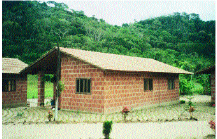
© Francisco J. Casanova, Río de Janeiro

La semilla de la obra revolucionaria de Casanova tiene su origen en 1973; estudiaba ingeniería y empezó a bregar con las tecnologías de pavimentación. “Hasta que un día me dije: ¿por qué la gente no aplica estos conocimientos para fabricar ladrillos? Si se abaratan las carreteras, ¿por qué no las casas?” Años después, un alumno de Casanova recibió una carta de alguien que había comprado una prensa para fabricar ladrillos y no sabía usarla. El profesor le ayudó y, tras la publicación de una reseña en una revista de gran difusión, terminó creándose una demanda de personas interesadas en aprender a construir su propia casa. Las ofertas de inversiones no tardaron en llegar, aunque pocas se materializaron.