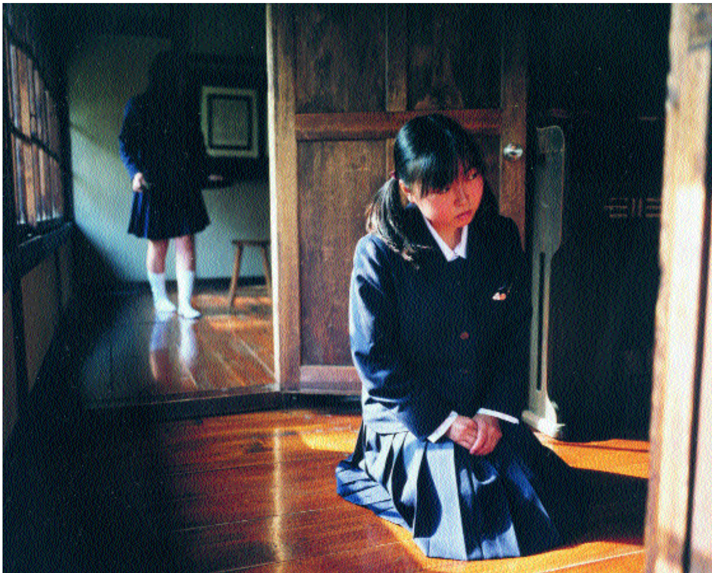
Ceremonia del té en la Escuela Agrícola de Hanamaki. Disciplina interior, serenidad y armonía son tres claves de la cultura tradicional del Japón.