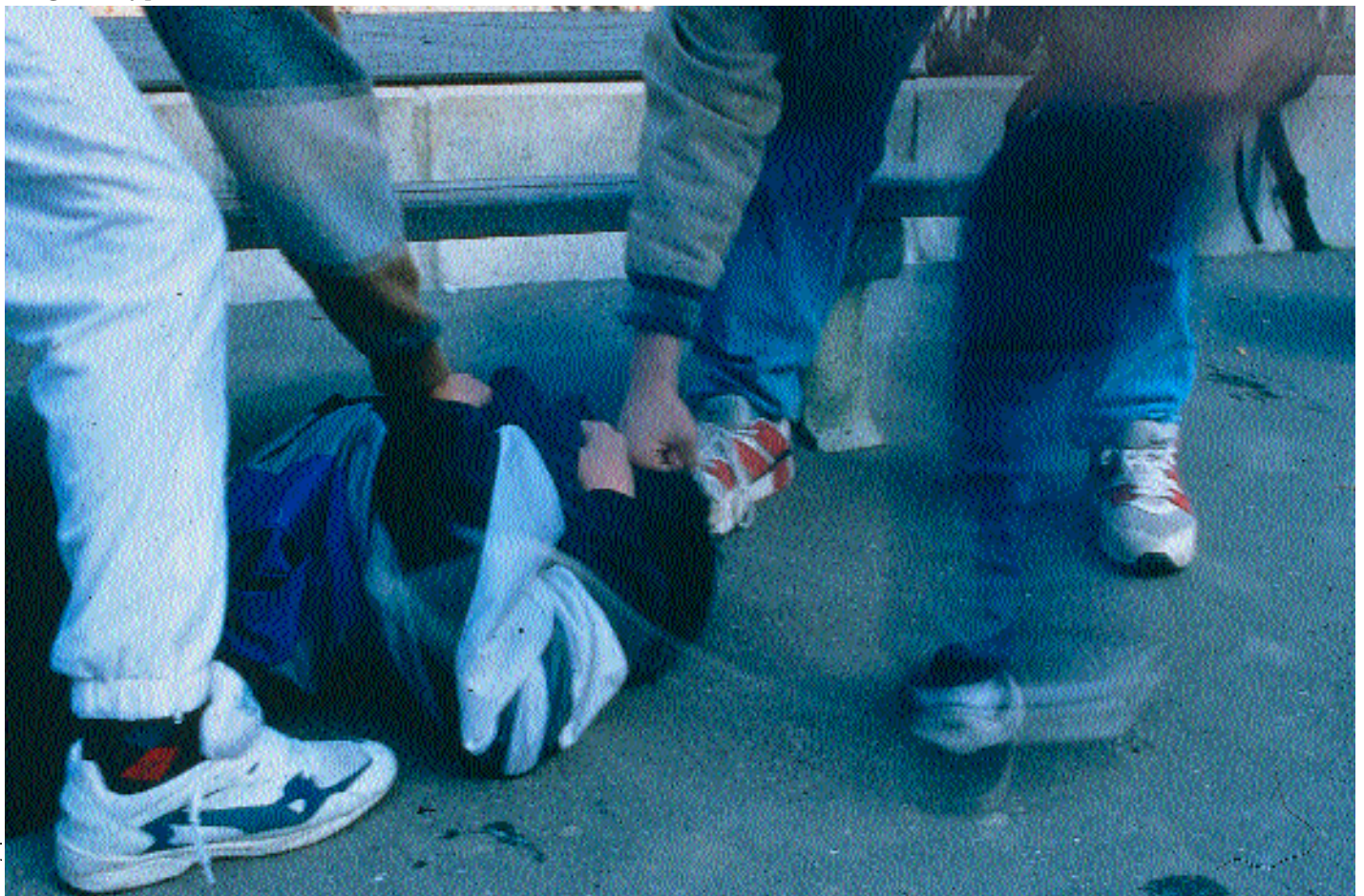
Las agresiones y peleas entre alumnos enturbian a menudo la buena marcha de los cursos escolares.

Programa SAVE: Universidad de Sevilla. Facultad de Psicología. Dpto. de Psicología Evolutiva y de la Educación San Francisco Javier, s/n 41005 Sevilla, España. Correo electrónico: ortega@cica.es