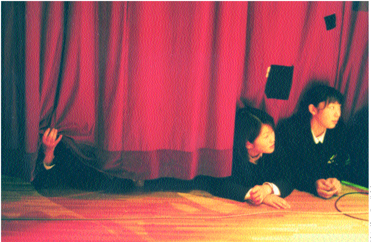
¡Todo el mundo al escenario! Las alumnas espían una representación teatral en la Escuela Agrícola de Hanamaki, en el norte de la isla de Honshu. Todas las fotos de este reportaje fueron tomadas en 1998.

Durante más de un siglo, la sociedad japonesa aunó esfuerzos para alcanzar a Occidente. Esa época ha quedado atrás y los jóvenes nipones enfrentan un mundo sin piedad.