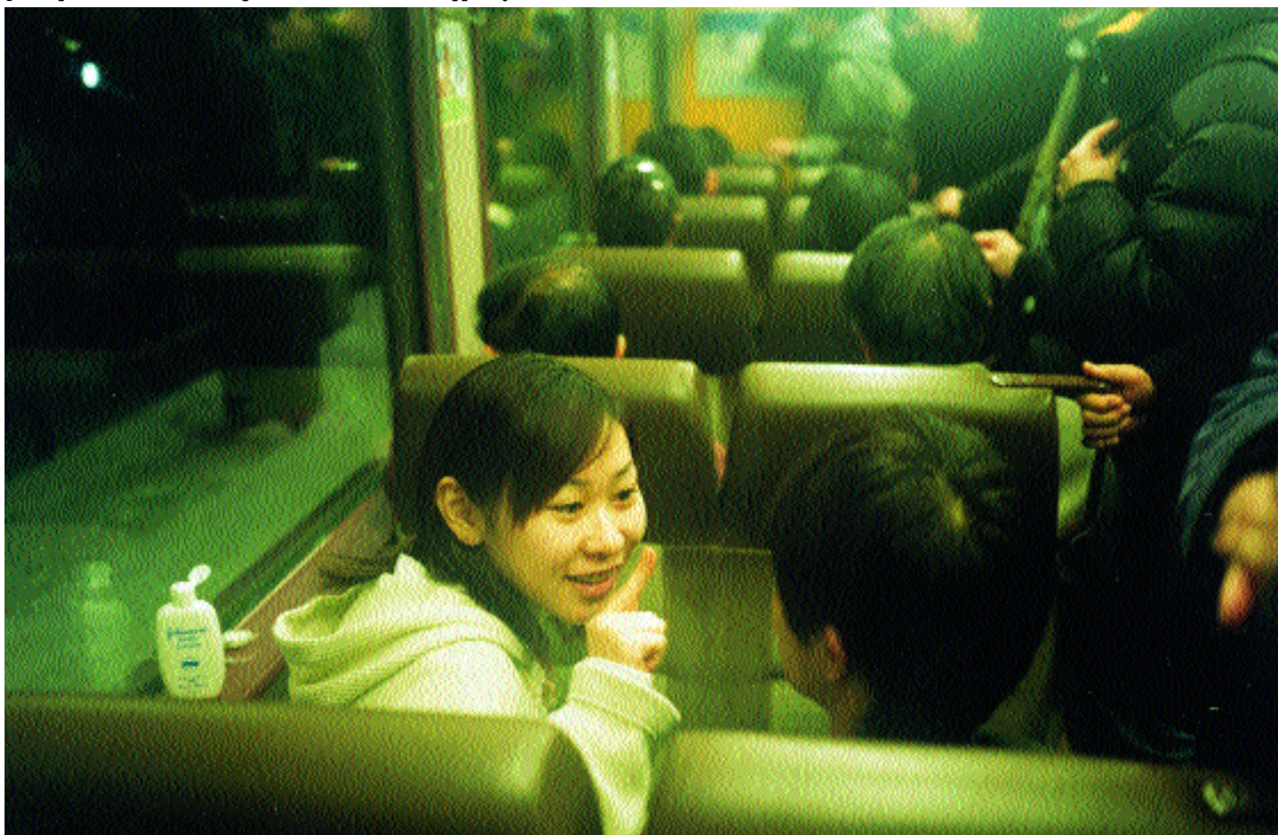
¿Un toqucito de crema? De viaje en un tren local entre Sapporo y Otaru.