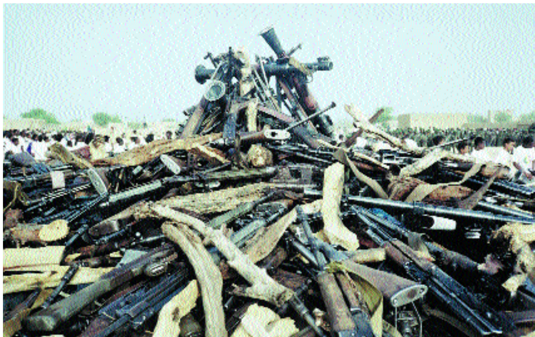
En esta ceremonia de "la llama de la paz" se quemaron 3.000 armas el 27 de marzo de 1996.