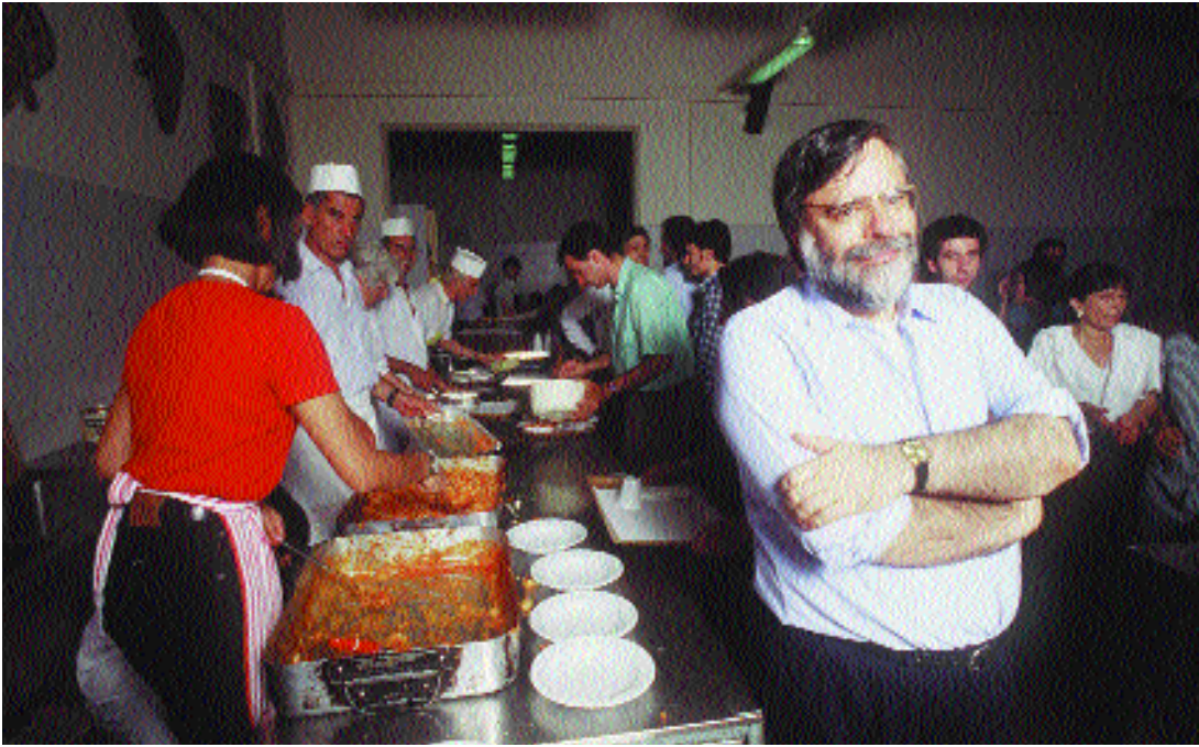
Andrea Riccardi, fundador de la Comunidad Sant'Egidio, en uno de los comedores para indigentes del movimiento.

► y la mediación tiene que dar algún fruto: debido a la presión de la opinión pública o a la inminencia de las elecciones no puede correr el riesgo de un fracaso que afectaría a su credibilidad. Pero ¿cómo se puede pretender resolver en tres meses conflictos que duran decenios? La Comunidad no se fija una fecha límite. Las negociaciones de paz se iniciaron al mismo tiempo en Angola y Mozambique. Como las primeras quedaron concluidas en tres meses y medio, algunos analistas pusieron de relieve que la mediación mozambiqueña estaba estancada.