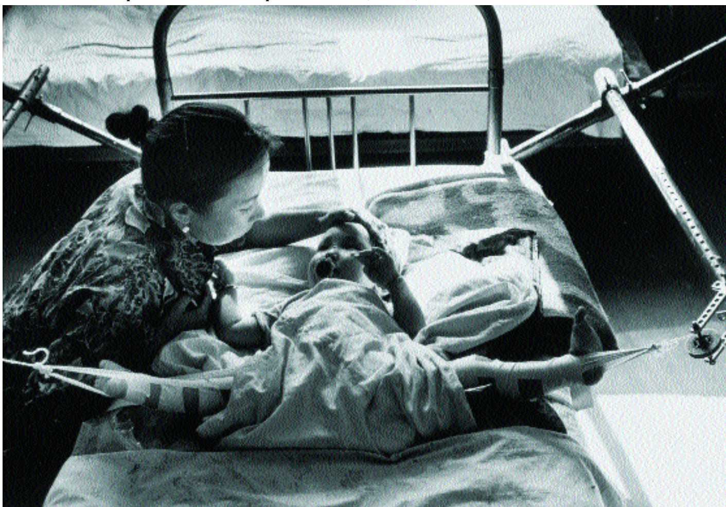
Un bebé recibe tratamiento por una malformación en el hospital infantil de Nukus (Uzbekistán).