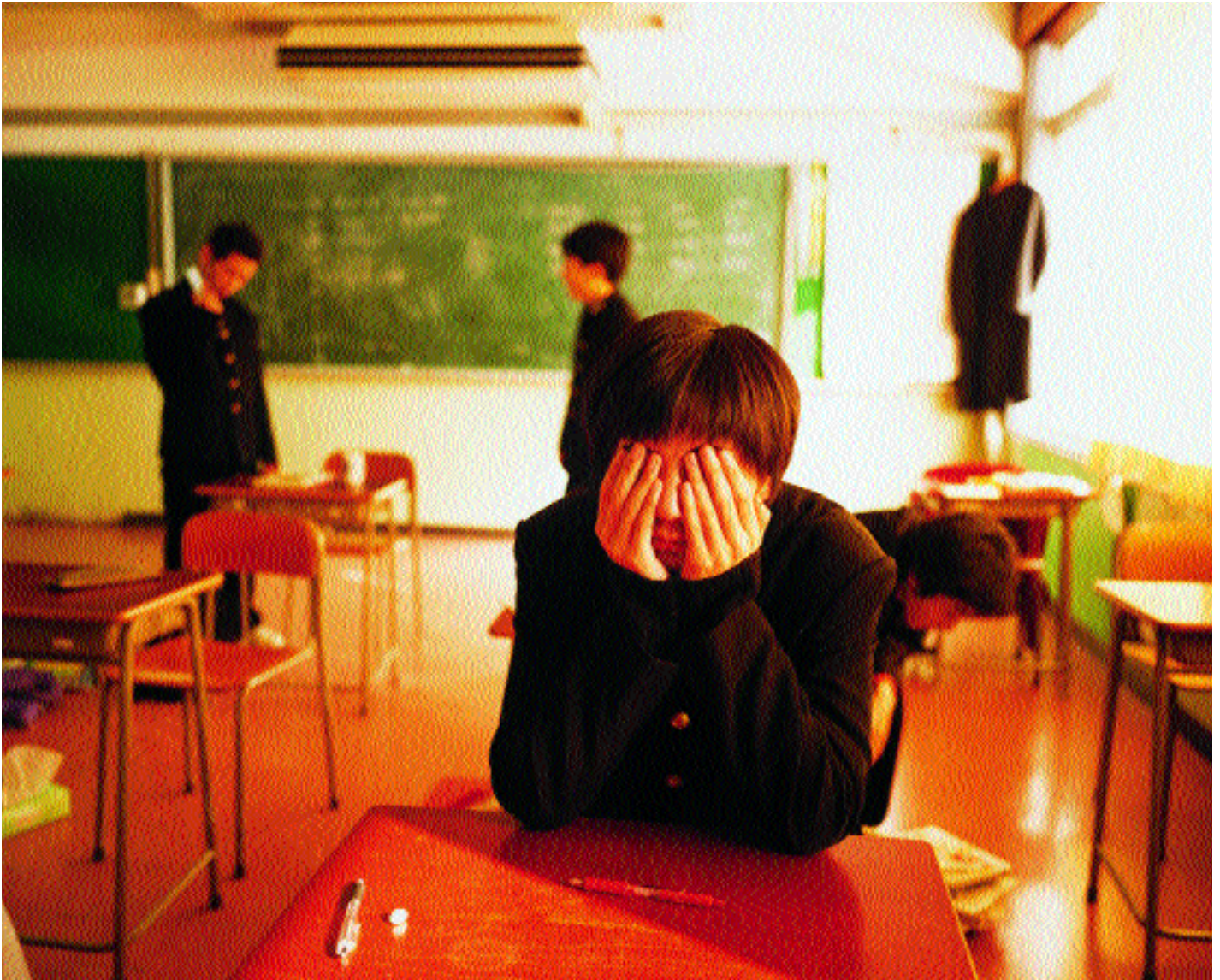
Un alumno agotado al término de una larga jornada de clase, Escuela Agrícola de Hanamaki.