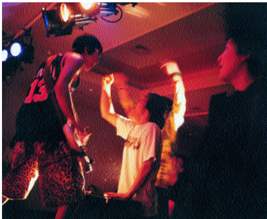
Un concierto de rock en el Centro Telecom de Tokio.