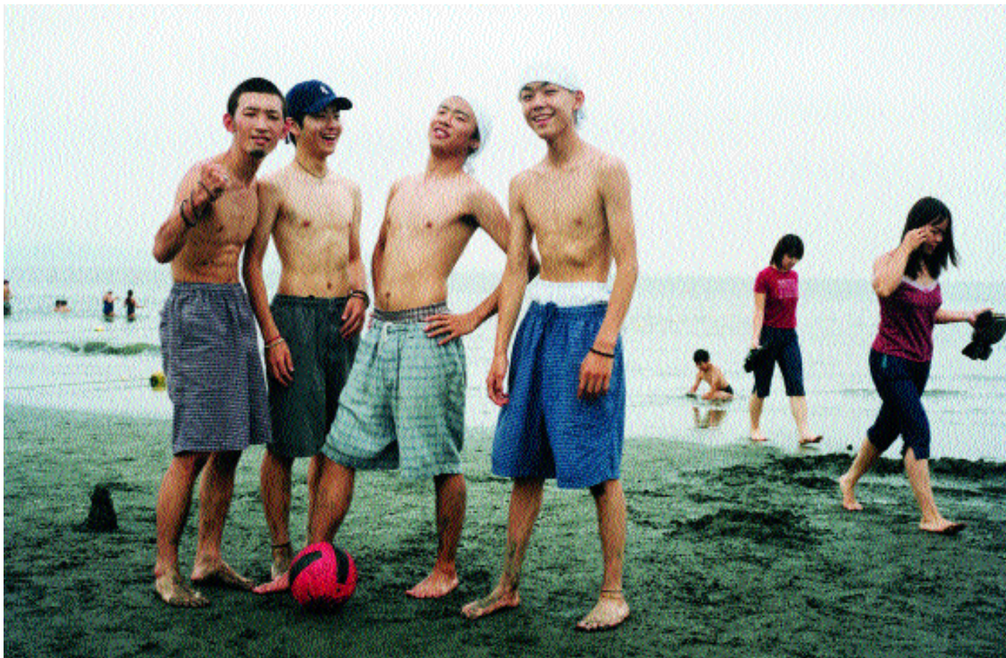
Una pausa durante un partido de fútbol en la playa de Enoshima, un balneario cerca de Tokio. El fútbol es cada vez más popular en el Japón que, conjuntamente con Corea, acogerá la Copa del Mundo en 2002.