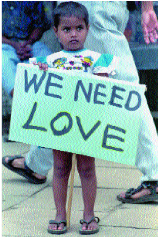
“Necesitamos amor” es el mensaje de este pequeño de Colombo (Sri Lanka) en una manifestación contra el trabajo infantil, en 1997.

Un papel importante, siempre y cuando no caigamos una vez más en interpretaciones mecanicistas. Salta a la vista que, en materia de medio ambiente, derechos humanos o comercio, Internet cumple un papel decisivo en la movilización de los ciudadanos. La velocidad con que se intercambian las informaciones refuerza en gran medida la construcción de plataformas de protesta. La movilización de los actores sociales es indiscutiblemente más rápida que la de los Estados. Pero, una vez más, no hay oposición entre esos dos polos. Se puede pensar que la movilización social de los europeos contra los organismos genéticamente modificados es una baza con que cuenta la Comisión de Bruselas frente a los Estados Unidos, por ejemplo.