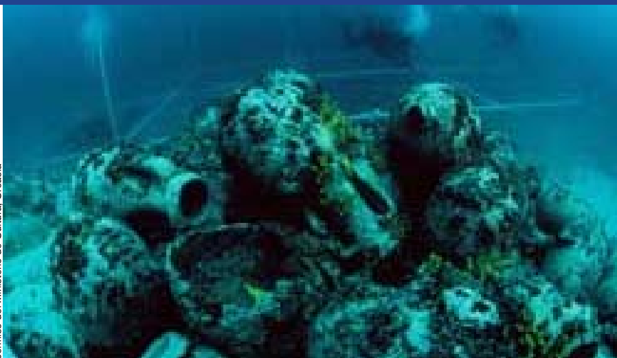
Ánforas del siglo I a.C., halladas en las aguas litorales de la isla de Pag (Croacia).