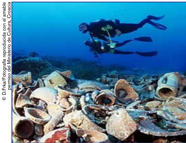
Vestigios arqueológicos submarinos del siglo I a.C. (Croacia).