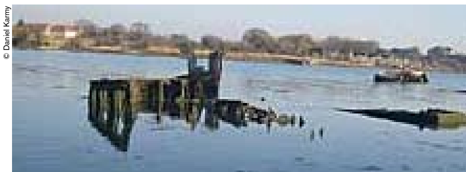
Los habitantes del lugar pasan a diario junto a este pecio de una embarcación de madera.