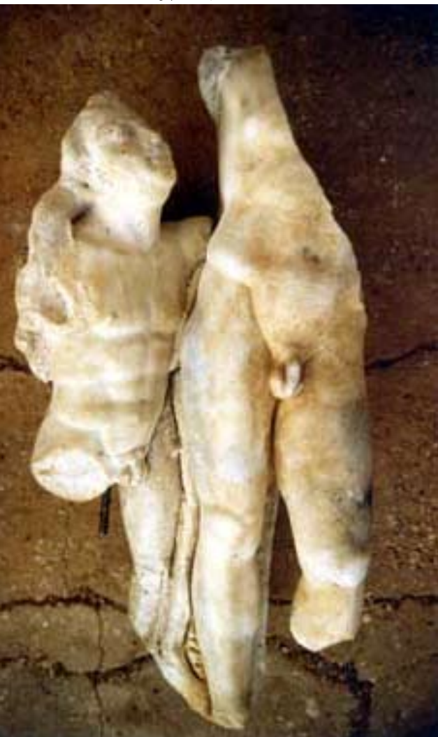
El "Dionisos ebrio" reconstituido.