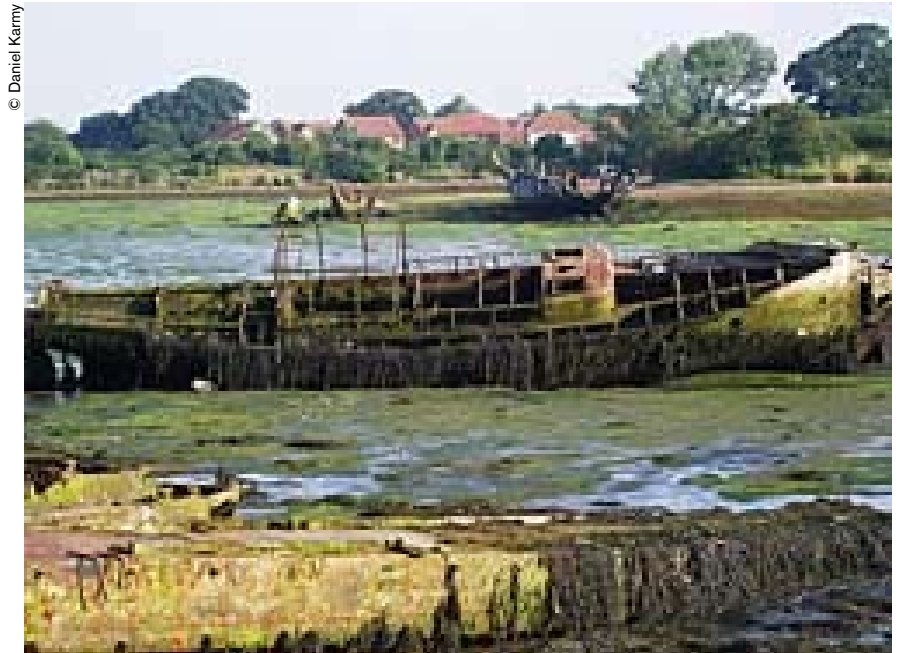
Un par de botas de pesca es todo el pertrecho que se necesita para explorar los pecios de Forton Lake.

El Mary Rose , navío de guerra favorito del soberano inglés Enrique VIII, naufragó en 1545, al poco de zarpar de Portsmouth para atajar una flota francesa que pretendía invadir Inglaterra. Hoy en día, sus restos extraídos del fondo del mar figuran entre los vestigios submarinos más famosos del mundo. Enterrado en el cieno y envuelto en una oscuridad casi total, el casco del Mary Rose fue localizado cuatro siglos después, gracias a un sonar sumamente perfeccionado. Izados a la superficie en 1982, el pecio y numerosos objetos del Mary Rose son admirados hoy por los 600.000 visitantes que acuden cada año al museo especialmente dedicado a este navío, que se halla situado en Portsmouth (Reino Unido), a unas pocas millas del lugar del naufragio.