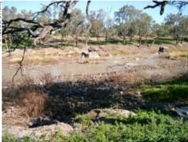
Trampas para peces en el río Darling (Australia).

No obstante, la exploración de los sitios culturales sumergidos en el mar puede aportarnos muchos más conocimientos. Por encima del nivel actual del mar, sólo podemos efectuar exploraciones en las zonas donde