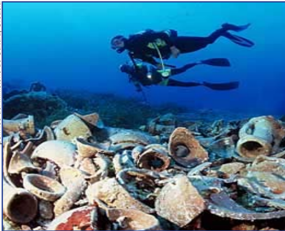
Vestigios arqueológicos submarinos del siglo I a.C. (Croacia).