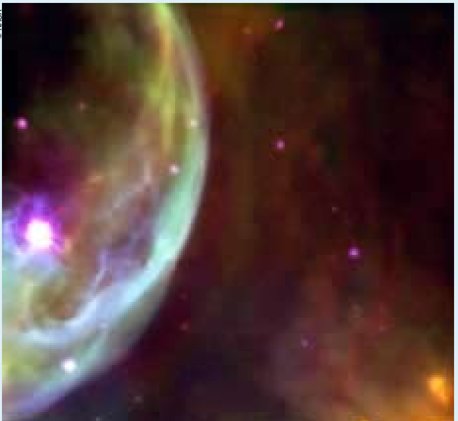
Imagen de una estrella de nuestra galaxia tomada por el telescopio espacial Hubble.

Nuestro deseo es que todos los países participen a la vez en del Año Internacional. Muchos de ellos ya han elaborado programas con tal motivo. También queremos que el público participe lo más posible. Nos gustaría que, al finalizar el Año Internacional, todas las personas que habitan la Tierra hayan escrutado el cielo un momento por lo menos, o hayan leído algo sobre los descubrimientos astronómicos más recientes..., o hayan meditado un poco sobre el puesto que ocupamos los seres humanos en el universo.