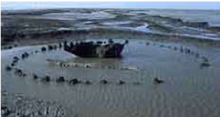
Llamado “Seahenge”, por analogía con el célebre “Stonehenge”, este sitio arqueológico marino del Reino Unido tiene 4.000 años de antigüedad. Todavía se ignora qué función desempeñaba.