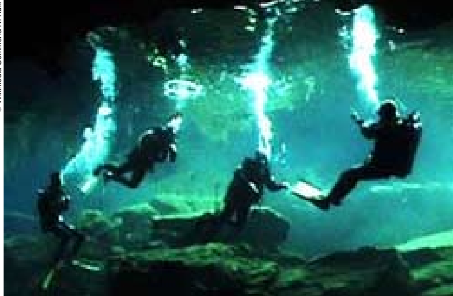
Buceando en un cenote yucateca (México).

La Convención de la UNESCO sobre la Protección del Patrimonio Cultural Subacuático es el primer instrumento jurídico internacional que permite proteger los sitios arqueológicos sumergidos del mundo entero, luchar contra su pillaje y reglamentar la cooperación internacional para su preservación.