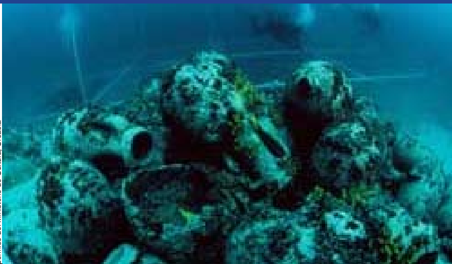
Ánforas del siglo I a.C., halladas en las aguas litorales de la isla de Pag (Croacia).