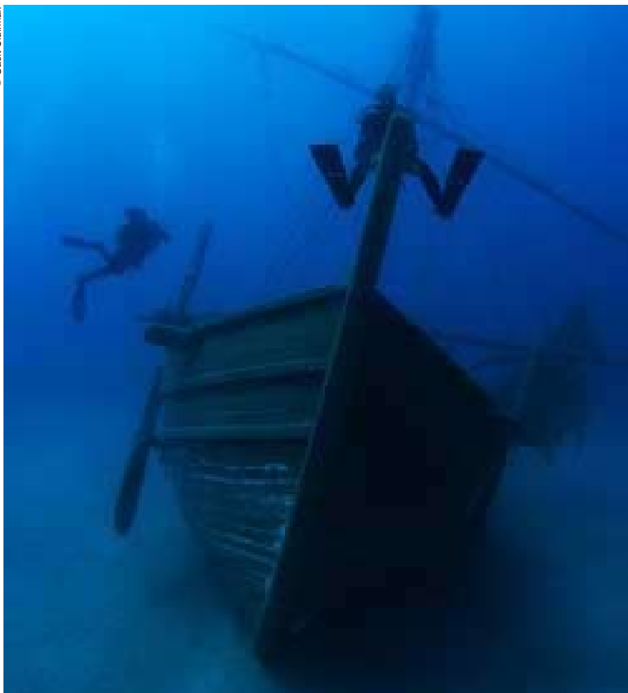
Uluburun III es una réplica exacta del pecio del Uluburun .

un simulacro realista del objeto sumergido con una resolución gráfica digna de los juegos informáticos más recientes.