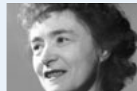
Gerty Cori (1896-1957)

Esta doctora, nacida en Praga, trabajó gratuitamente como investigadora mientras que su esposo estudiaba farmacología en la misma universidad estadounidense. Su larga relación profesional fue coronada, en 1947, con el Nobel, por el descubrimiento del metabolismo del glicógeno.