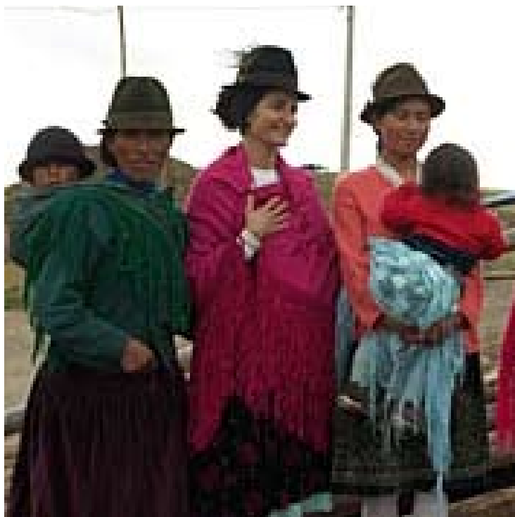
Comunidad de locutores de quichua en Cotopaxi (Ecuador).