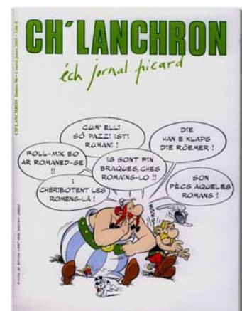
Portada de la versión picarda del cómic Asterix: en Francia se editan versiones de Asterix en seis lenguas regionales.