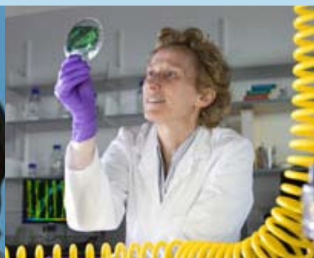
Athene M. Donald (Reino Unido)