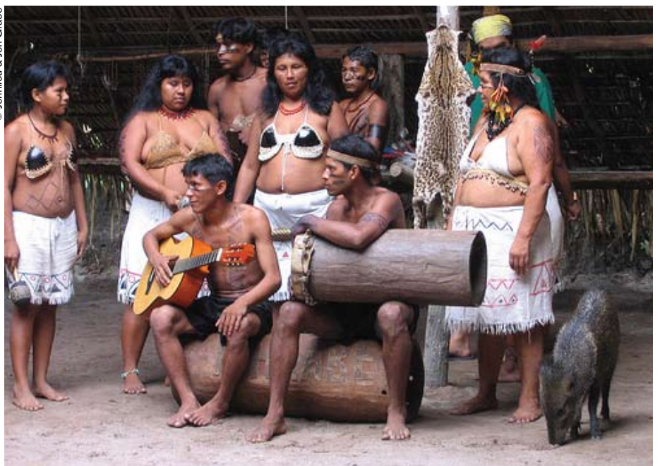
Amazonia (Brasil): varias lenguas indígenas están desapareciendo. Hasta mediados del siglo XVII, el tuli, por ejemplo, estaba tan extendido como el portugués.